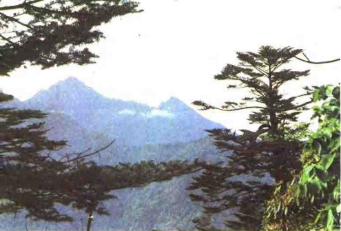
马边大风顶冷杉林