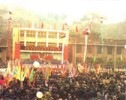
马边彝族自治县成立大会盛况