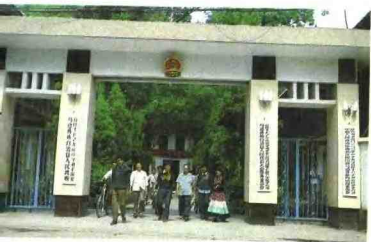
马边彝族自治县人民政府