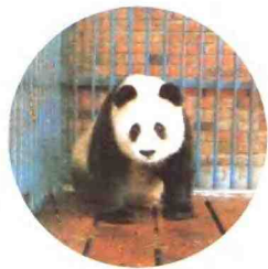
马边大熊猫“苏苏”幸福地生活 在成都动物园