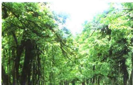
马边大风雨珙桐林