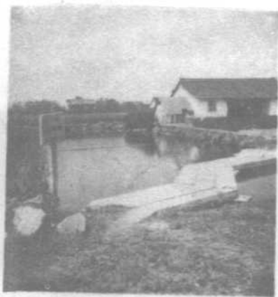
海宁“王氏园”（国维远祖王 沉所建，清代名“安澜园”） 中的“九曲桥”遗址。