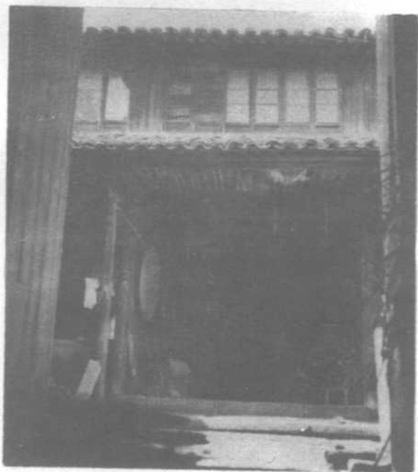
王国维故居内景。据其文《日记》手稿， 当年国维就住在这座楼上。《人间词》 中“夜起倚危楼”云云，或当指此。