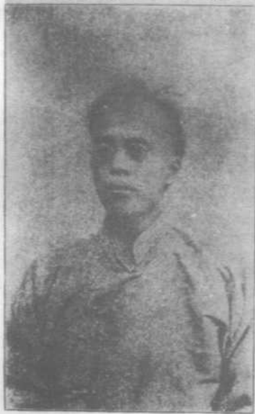
王国维前期小像。原载 《教育世界》第129号“肖像” 栏（1906年6月）。