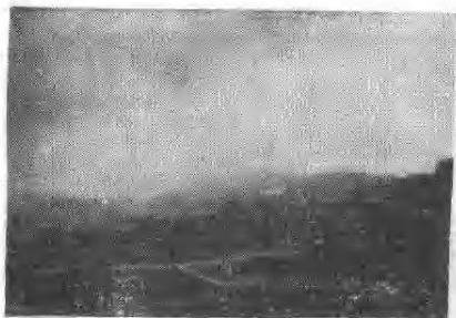
一九四九年武装暴动地点——良口寨