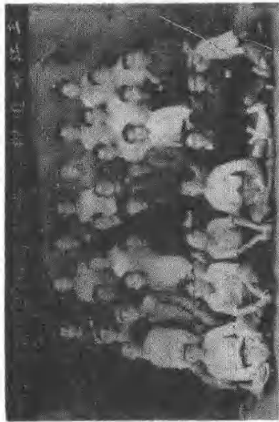
一九五〇年在柳州工作学习的三江县干部合影