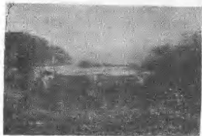
一九四九年武装暴动地点——六孟寨