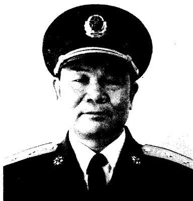
中国人民解放军总后勤部副部长 张 彬 中将