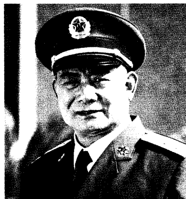
中国人民解放军兰州军区司令员 赵先顺 中将