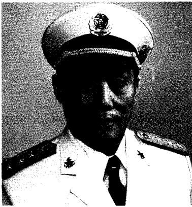
中国人民解放军海军政治委员 李耀文 上将