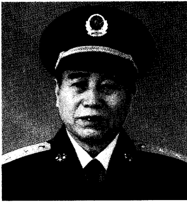
中国人民解放军南京军区政治委员 傅奎清 中将