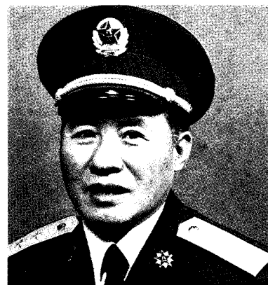
中国人民解放军济南军区政治委员 宋清渭 中将