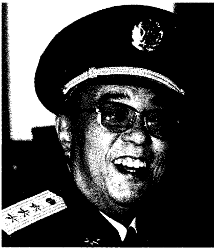
中华人民共和国中央军事委员会委员 中国人民解放军总政治部主任 杨白冰 上将