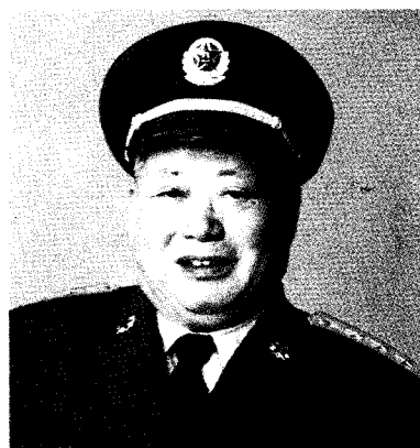
中国人民解放军北京军区政治委员 刘振华 上将