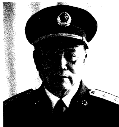
中国人民解放军兰州军区政治委员 李宣化 中将