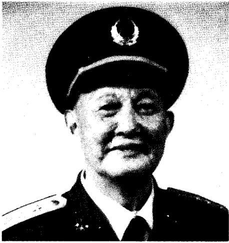
中国共产党中央军事委员会副秘书长 中华人民共和国中央军事委员会委员 洪学智 上将