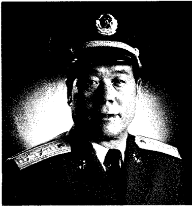
中国人民解放军成都军区司令员 傅全有 中将