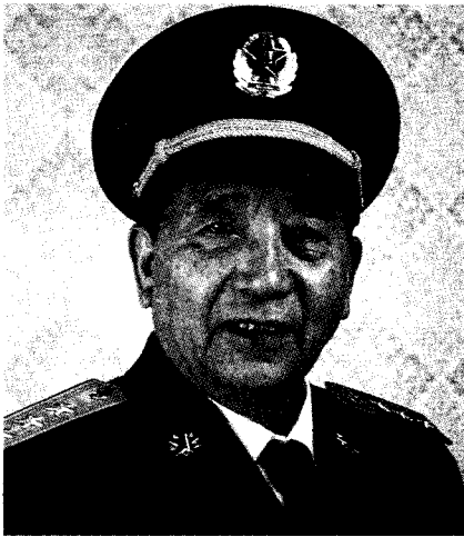
中华人民共和国中央军事委员会委员 中华人民共和国国务院国务委员兼国防部长 秦基伟 上将