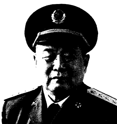
中国人民解放军国防大学政治委员 李德生 上将