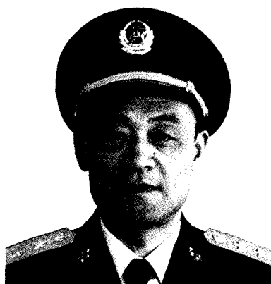
国防科学技术工业委员会主任 丁衡高 中将