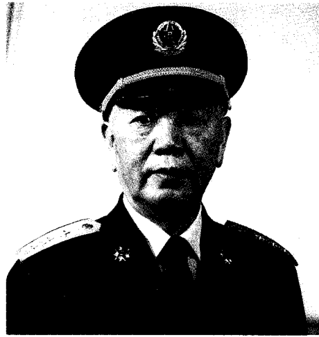
中国共产党中央军事委员会副秘书长 中华人民共和国中央军事委员会委员 刘华清 上将