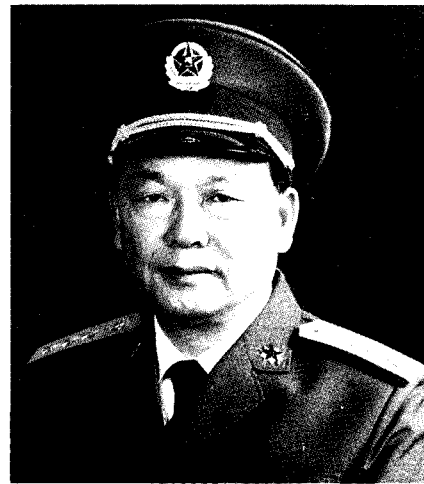
中华人民共和国中央军事委员会委员 中国人民解放军总后勤部部长 赵南起 上将