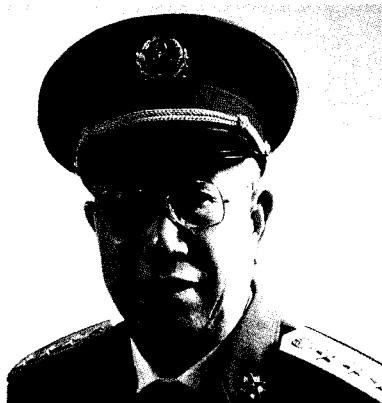
中央军事委员会纪律检查委员会书记 兼中国人民解放军总政治部副主任 郭林祥 上将