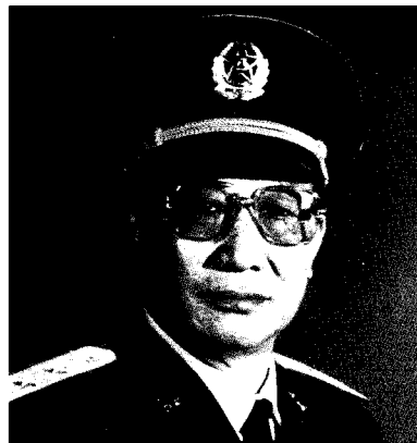
中国人民解放军北京军区司令员 周衣冰 中将