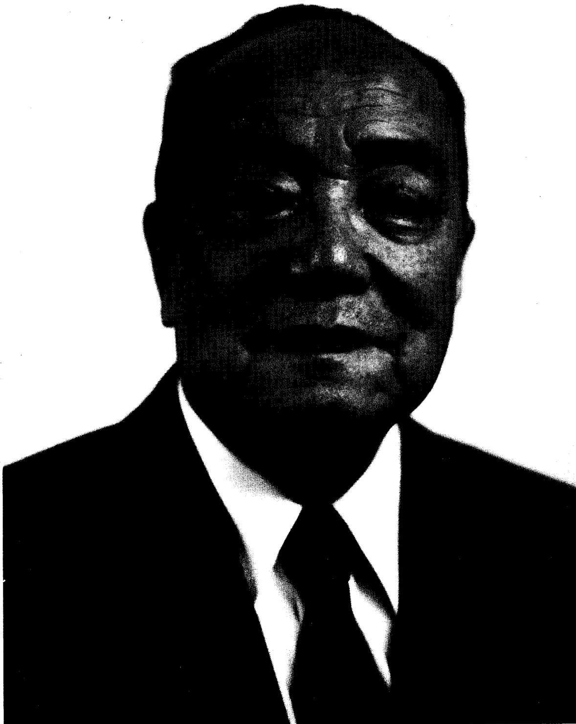
中国共产党中央军事委员会常务副主席兼秘书长 中华人民共和国中央军事委员会副主席 杨尚昆