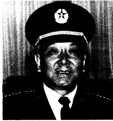
中国人民解放军空军司令员 王海 上将