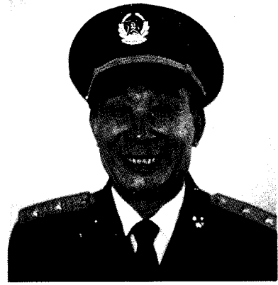
中国人民解放军广州军区政治委员 张仲先 中将