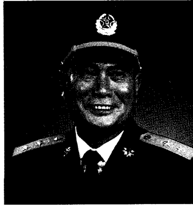
中国人民解放军广州军区司令员 张万年 中将