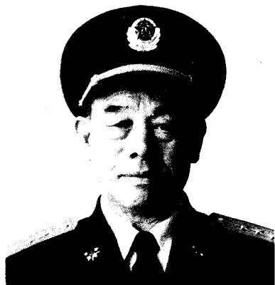
中国人民解放军副总参谋长 徐 信 上将