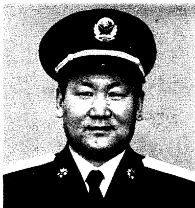
中国人民解放军沈阳军区司令员 刘精松 中将