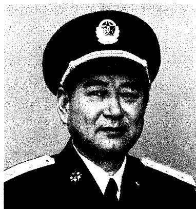
中国人民解放军沈阳军区政治委员 宋克达 中将