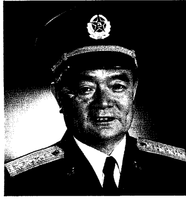
中国人民解放军成都军区政治委员 万海峰 上将