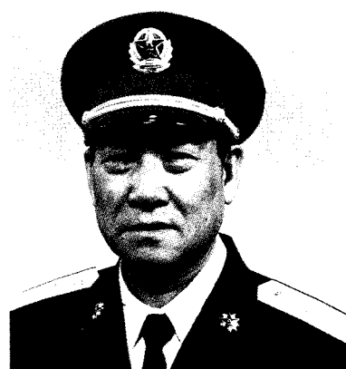
中国人民解放军济南军区司令员 李九龙 中将