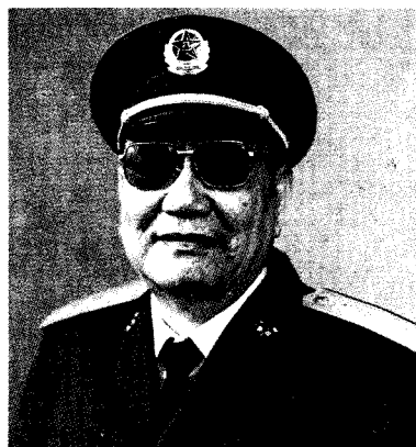
中央军事委员会纪律检查委员会第二书记 尤太忠 上将