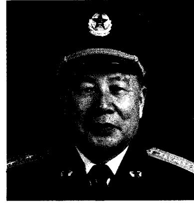
中国人民解放军空军政治委员 朱光 中将