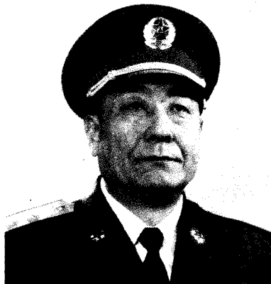
中国人民解放军副总参谋长 徐惠滋 中将