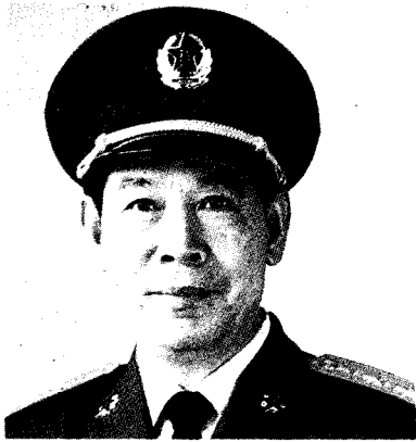
中国人民解放军第二炮兵司令员 李旭阁 中将