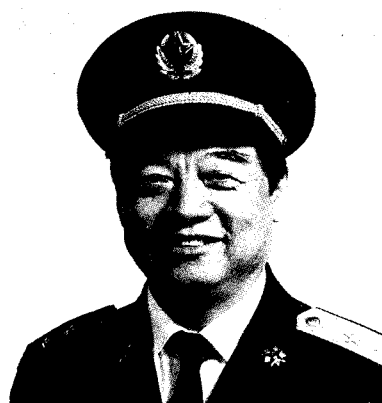
中国人民解放军总政治部副主任 周克玉 中将