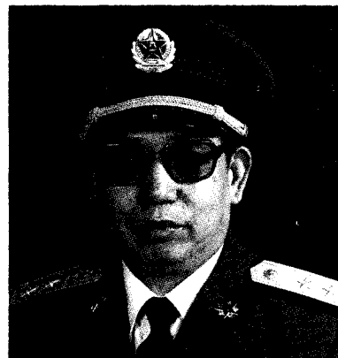
中国人民解放军总后勤部副部长 刘明璞 中将