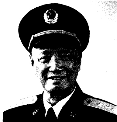
中国人民解放军国防大学校长 张 震 上将