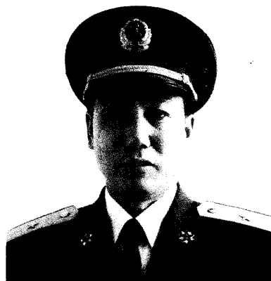
中国人民解放军总后勤部副部长 宗顺留 少将