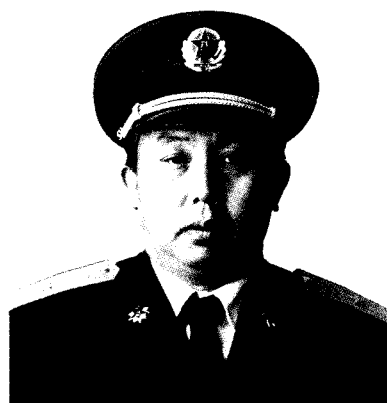
中国人民解放军副总参谋长 何其宗 少将