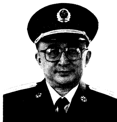
国防科学技术工业委员会政治委员 伍绍祖 少将