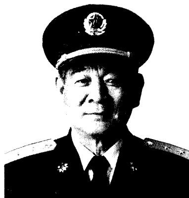
中国人民解放军副总参谋长 韩怀智 中将