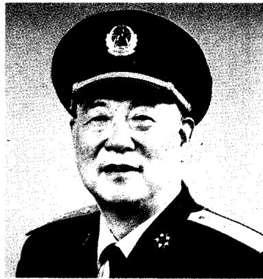
中国人民解放军第二炮兵政治委员 刘立封 中将