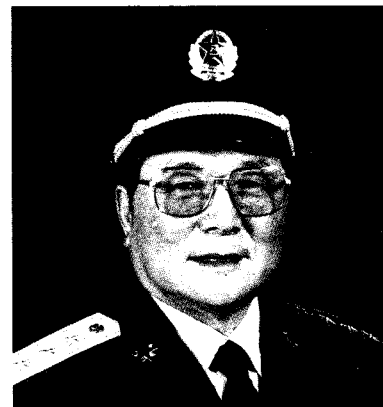
中国人民解放军南京军区司令员 向守志 上将