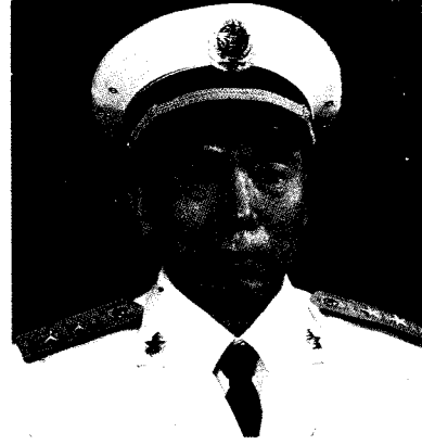
中国人民解放军海军司令员 张连忠 中将