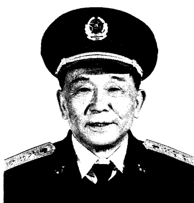
中国人民解放军军事科学院政治委员 王诚汉 上将