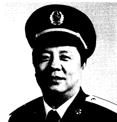
中国人民解放军总政治部副主任 周文元 少将