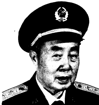
中国人民解放军军事科学院院长 郑文翰 中将