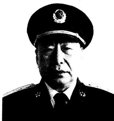
中国人民解放军总后勤部政治委员 刘安元 中将