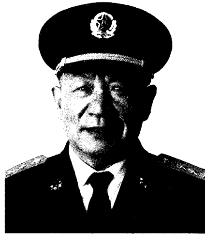
中华人民共和国中央军事委员会委员 中国人民解放军总参谋长 迟浩田 上将