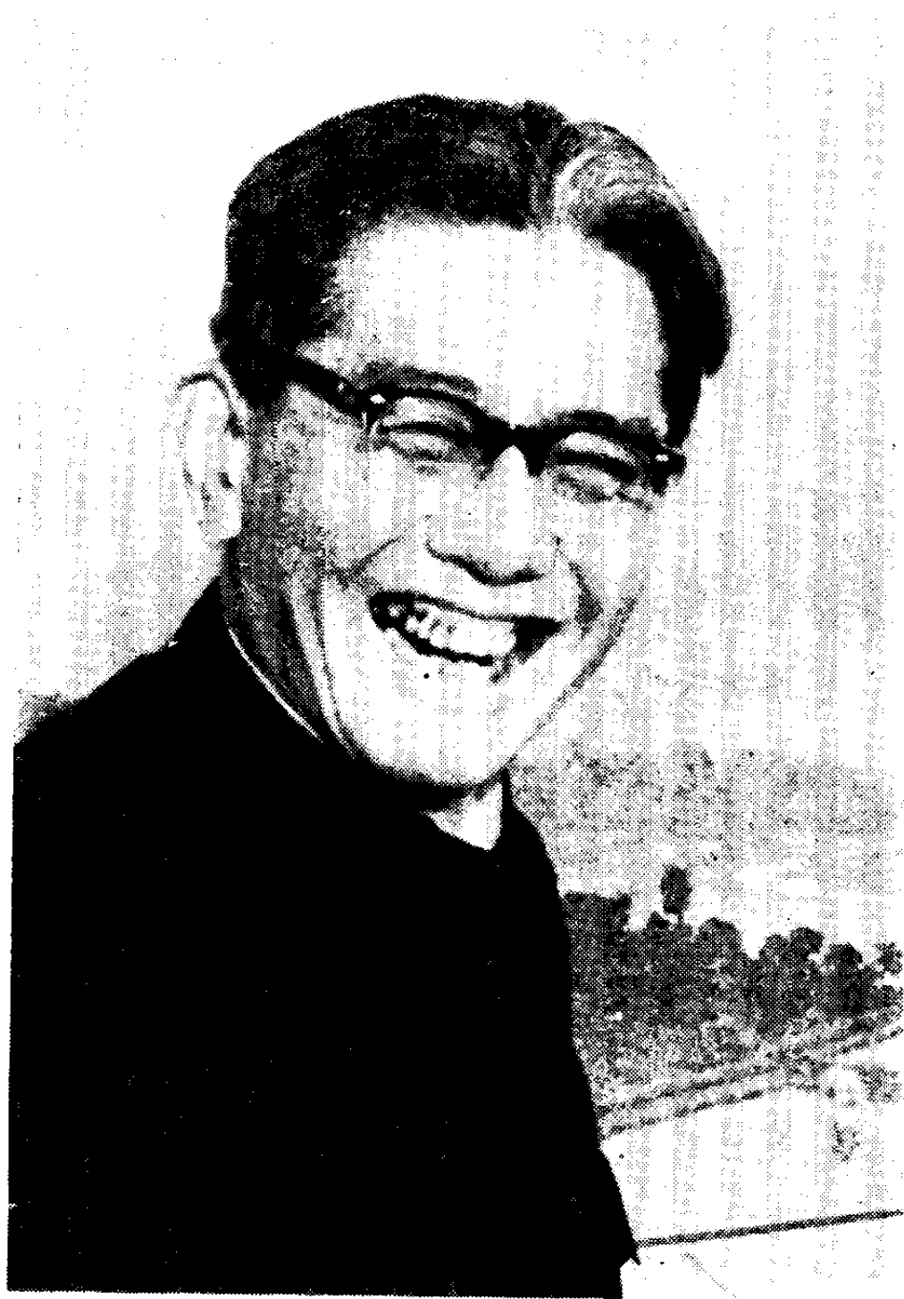
1972年作者出席联合国大会时留影