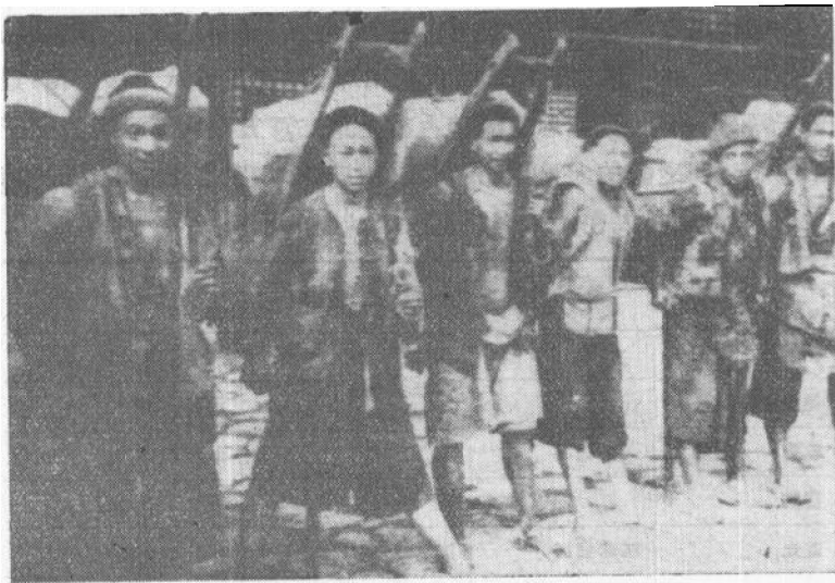
没有土地的农民靠出卖劳力谋生

土地集中的过程,也就是大量农民失去土地,沦为佃户或流民的过程。当时就有人指出:“近日田之归于富户者,大约十之五六,旧时有田之人,今俱为佃耕之户。” ① 在地租、高利贷、赋税和徭役的重重压榨下,农民终岁勤劳,尚不足以交租还债,终至弃田逃亡,卖儿鬻女,转徙沟壑。在许多地区,流民“扶老携幼,千百为群,到处络绎不绝。” ② 饿殍载道的悲惨景象,与贵胄豪门的骄奢淫逸生活恰成鲜明的对照。