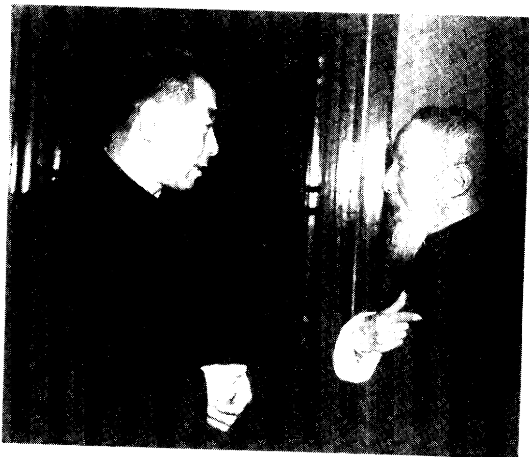
一九五四年在中南海紫光阁 周恩来总理和孔伯华先生谈话