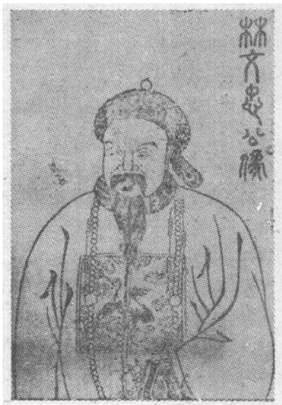
林 则 徐

始禁烟。他通过当时与外国进行贸易的“十三行”商人，严令外国走私烟贩交出全部鸦片烟土，并向中国政府具结，保证以后“永不夹带鸦片”。他宣布“若鸦片一日未绝，本大臣一日不回，誓与此事相始终，断无中止之理” ① ，表示了禁烟的坚定决心。英国商务监督义律公开抵制和破坏这个禁令，并阻止英商缴烟具结。3月24日，义律从澳门进入广州，企图率领外国鸦片贩子连夜逃走。