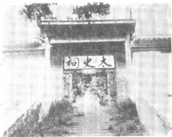
陕西韩城南芝川镇 太史公祠正门