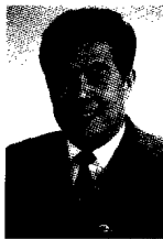
湖北省人民政府副省長 徐鳴航