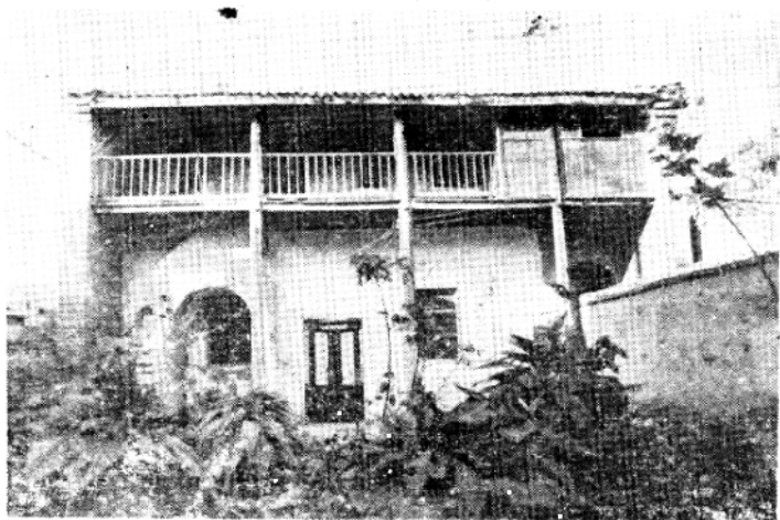
一、1927—1928杨虎城将军的军部所在地