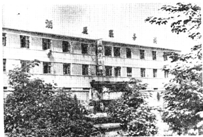
三、太和酒厂营业处