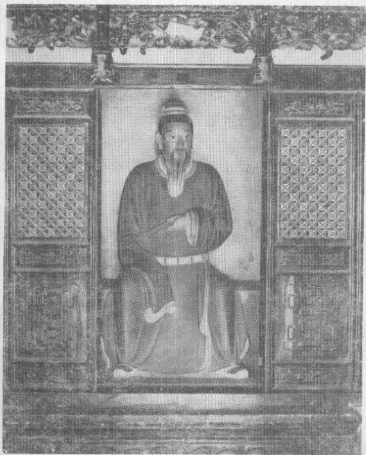
太史祠內的司馬遷彩色塑像