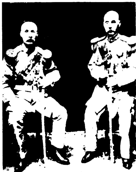
冯国璋（右）与段祺瑞（左）