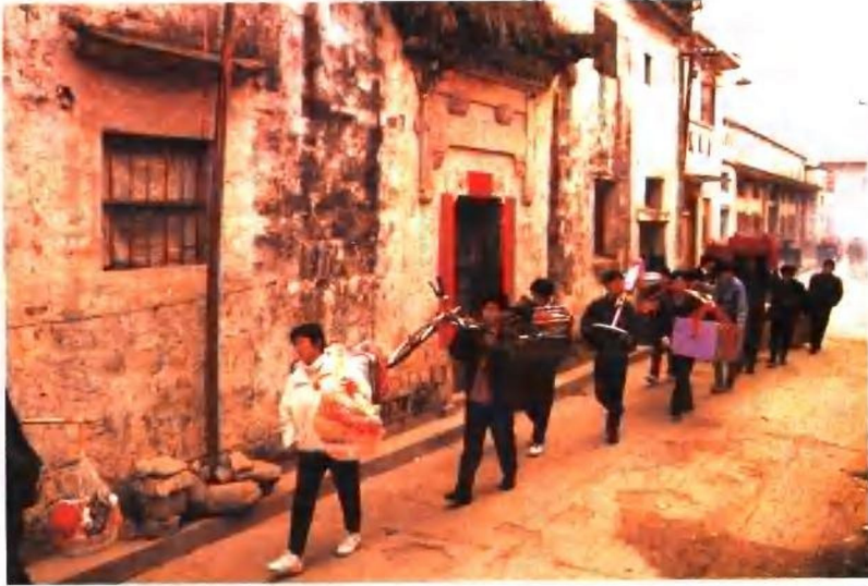
屯溪老街上的婚礼队伍