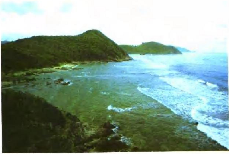
安徽第一湖——巢湖