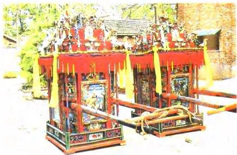
安徽民间艺术之花——亳州花轿