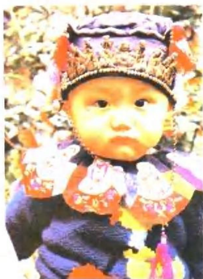
安徽民间、儿童帽子、围兜