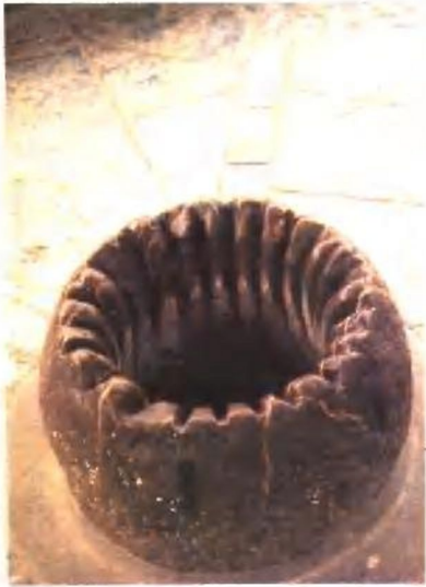
曹操将士饮水的“屋上井”