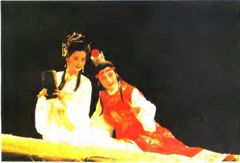
黄梅戏《红楼梦》马兰、吴亚玲