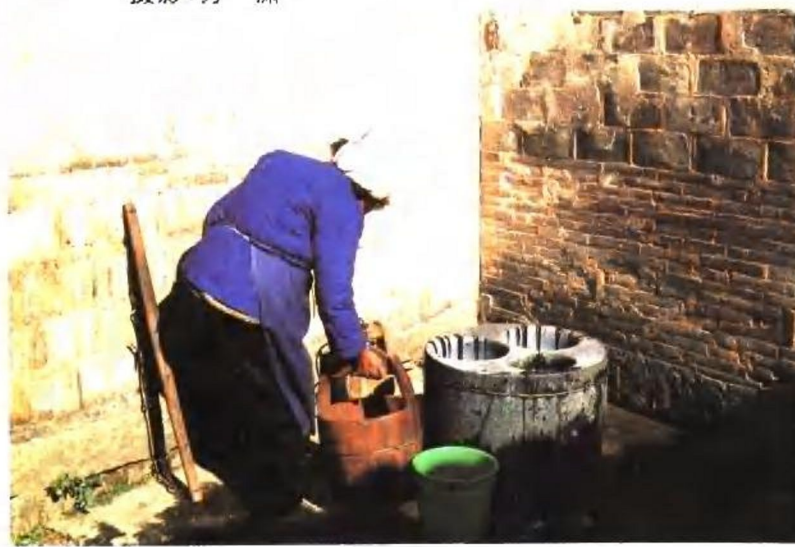
三 宝 井