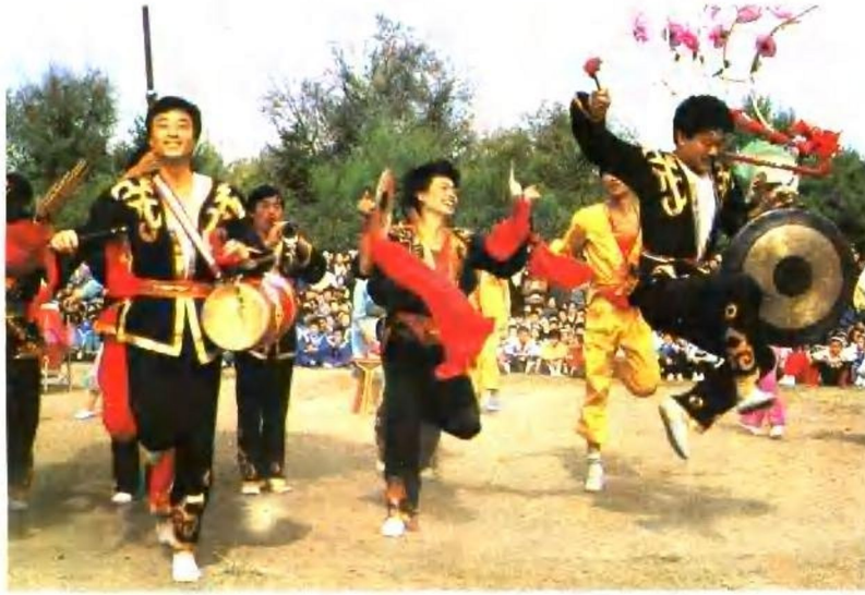
花鼓灯《欢腾的鼓乡》