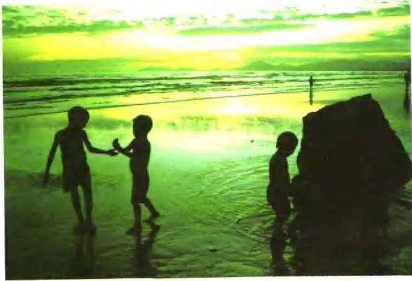
黄山脚下的太平湖退潮时