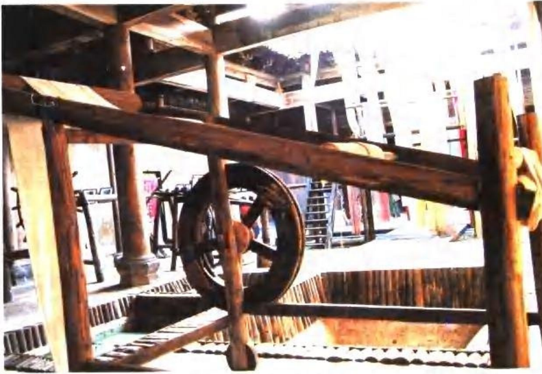
黟县南屏村染坊堂