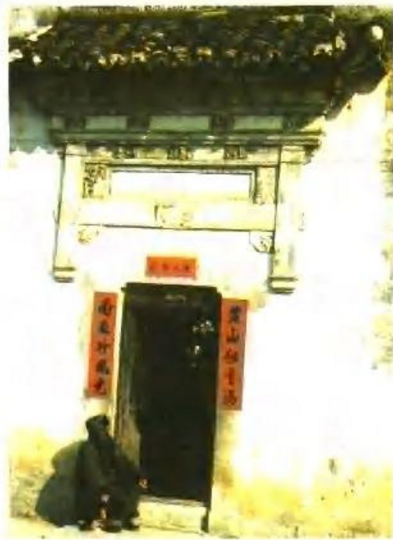
黄山脚下的山民