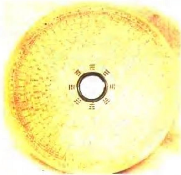
万安罗盘