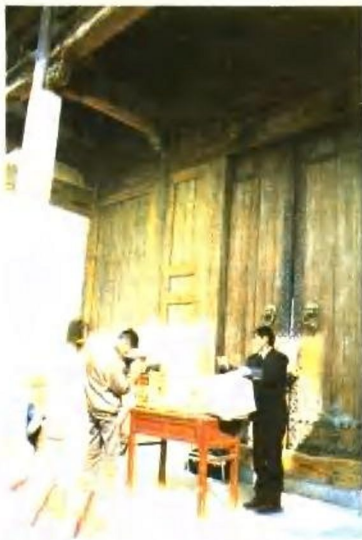
山村一年一度的斗鸟即将开始