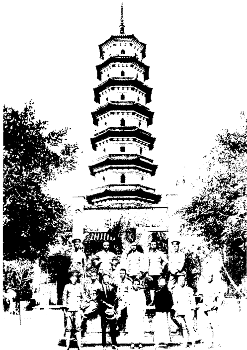
1 1924年底，徐向前(后排左一)在 广州六榕寺与黄埔同学留影