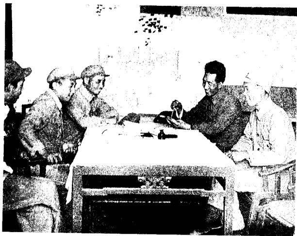
12 1948年6月，徐向前 (右二)任华北野战军 第一兵团司令员兼政 治委员时，在作战室 研究战况