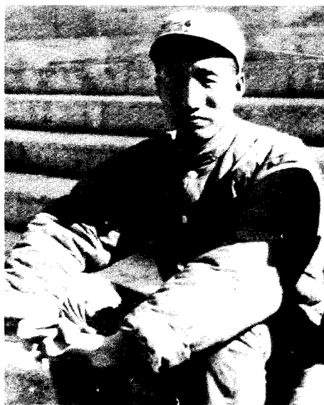
6 抗日战争初期，徐向前任八路军一二九师副师长