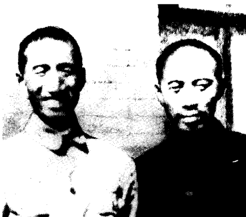
5 抗战前夕，徐向前与周恩来在西安办事处合影