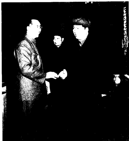
13 1953年， 徐向前，毛泽东主席亲切接见