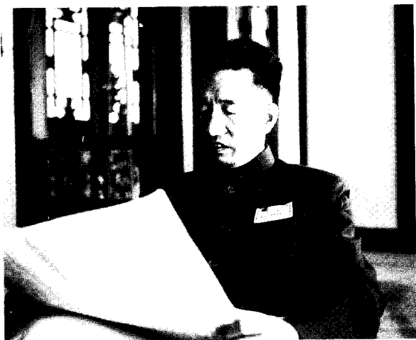
15 徐向前任总参谋长的年代