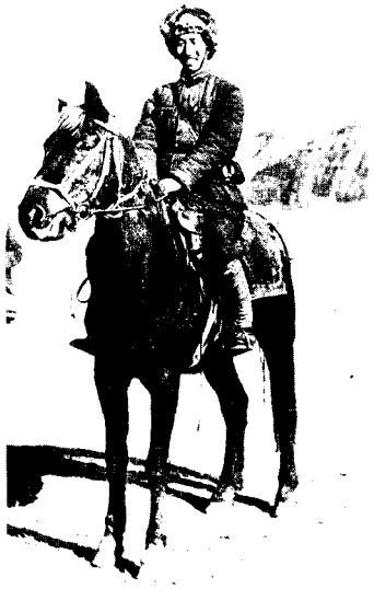
7 1941年春，徐向前在延安。坐骑是伏击日军时缴获的