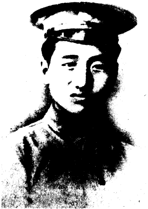
3 红军时期的徐向前