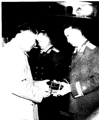
14 1955年9月27日 向前等授勋 毛泽东给徐