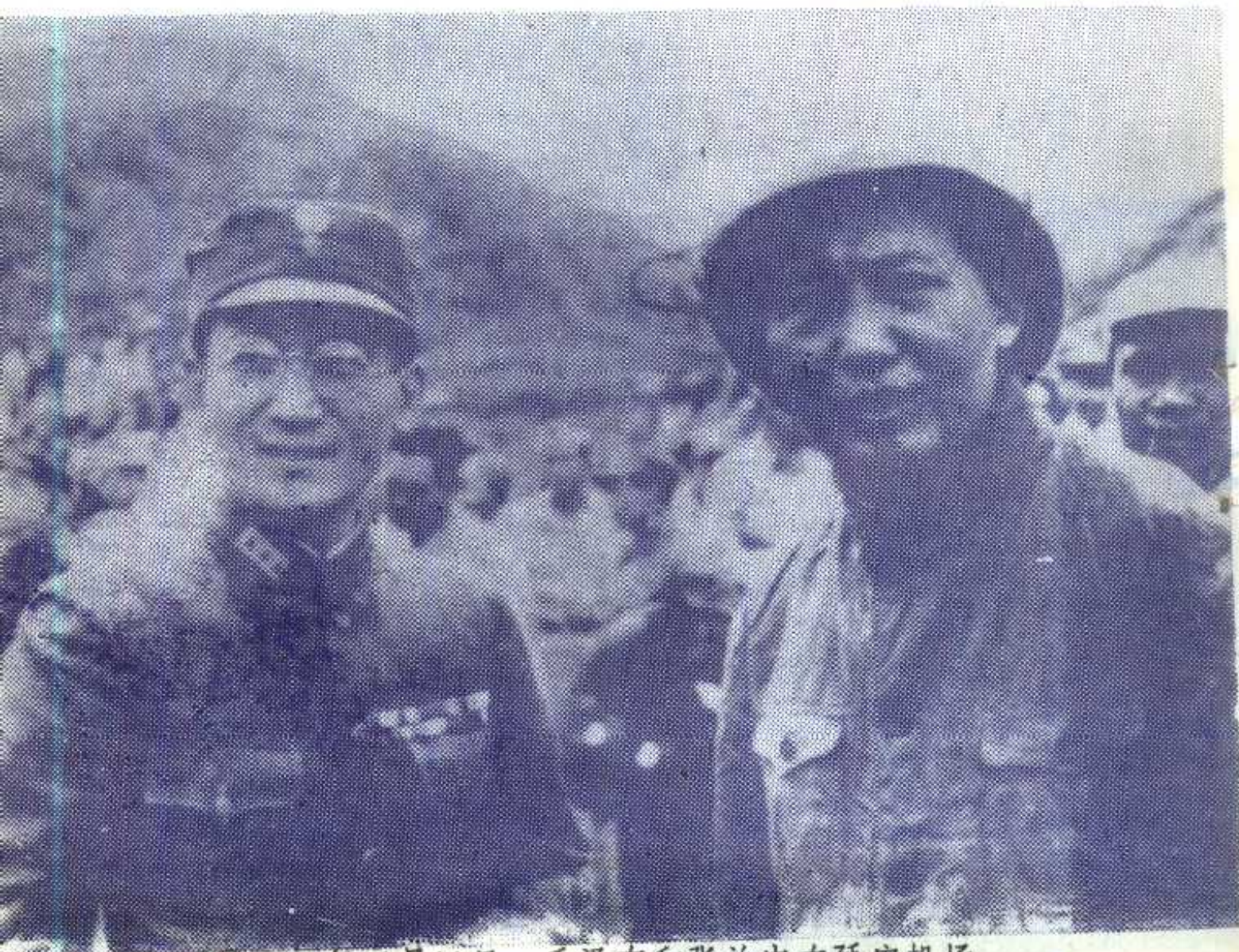
图④1945年10月11日，毛泽东和张治中在延安机场。