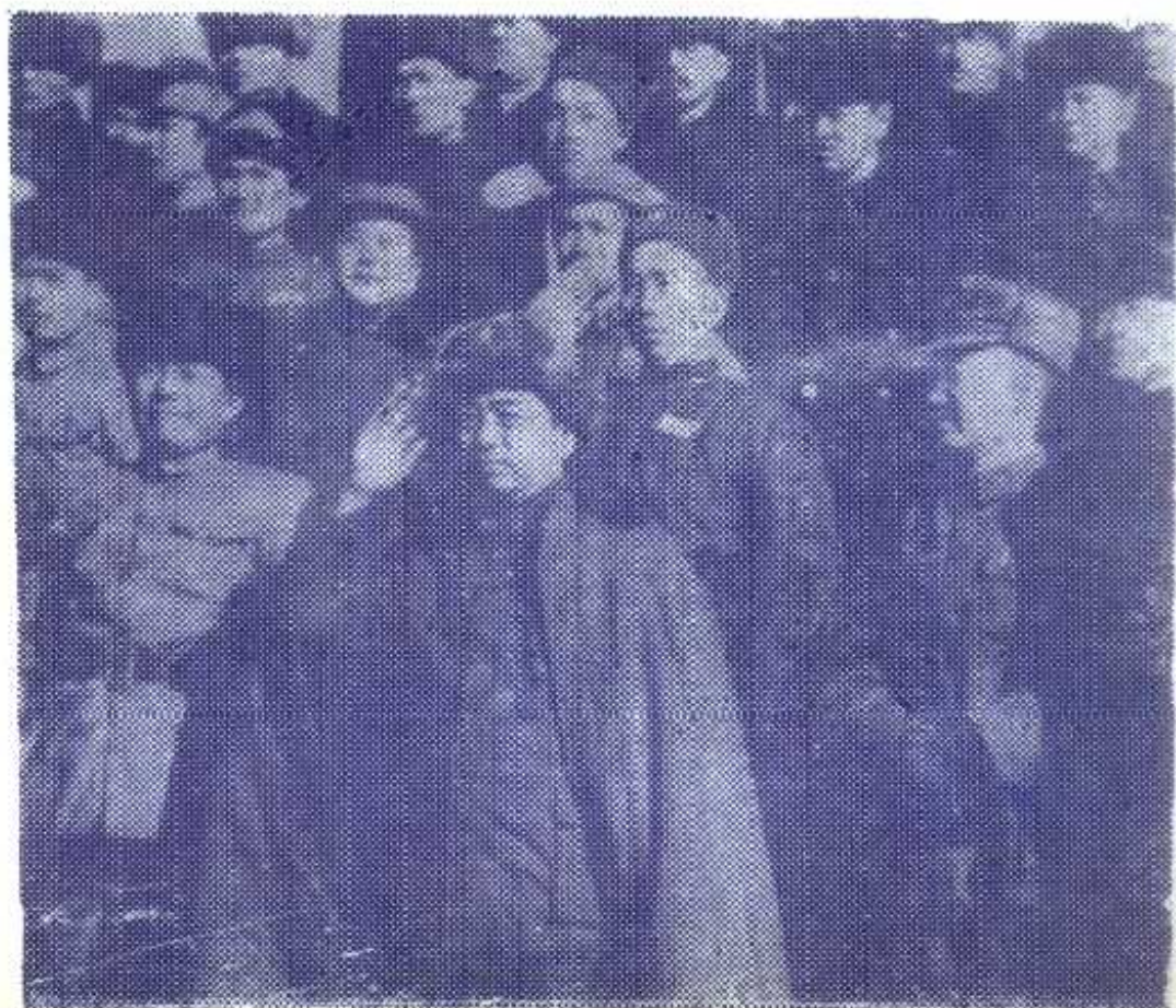
图⑥1949年 11月张治中和彭 总、王震同志在 迪化阅兵台上。