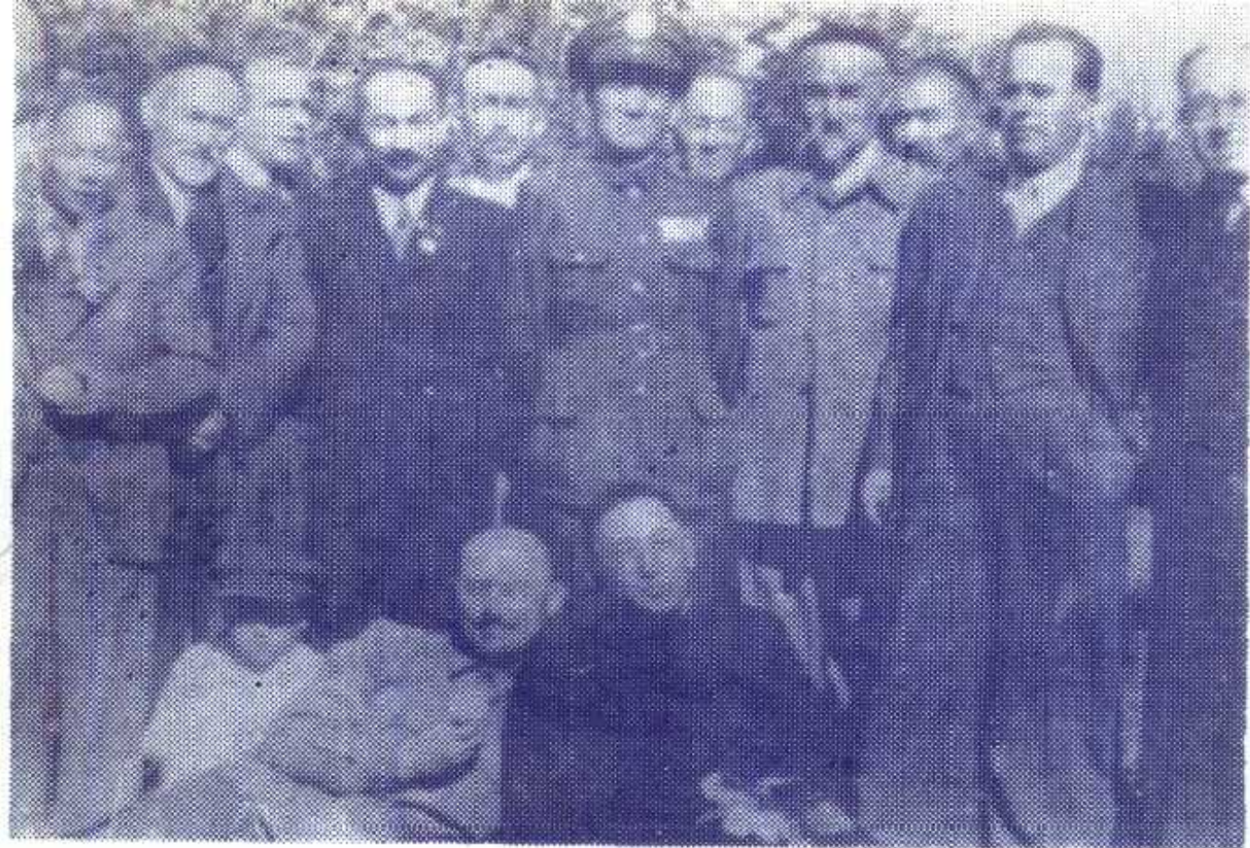
图⑤1946年，张治中等与三区领导人合影。前排右起为刘孟纯、赖希木江。中排右起第一人为屈武、第三人为艾肯木拜克和加、第四人为张治中、第五人为阿合买提江、第七人为刘泽荣。