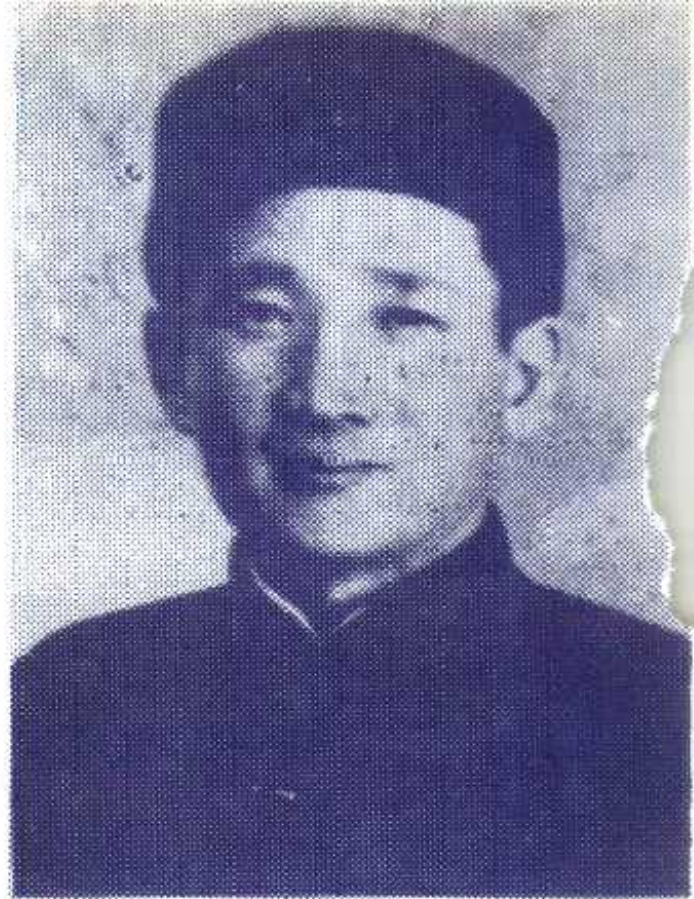
图③张治中在四十年代初期留影。