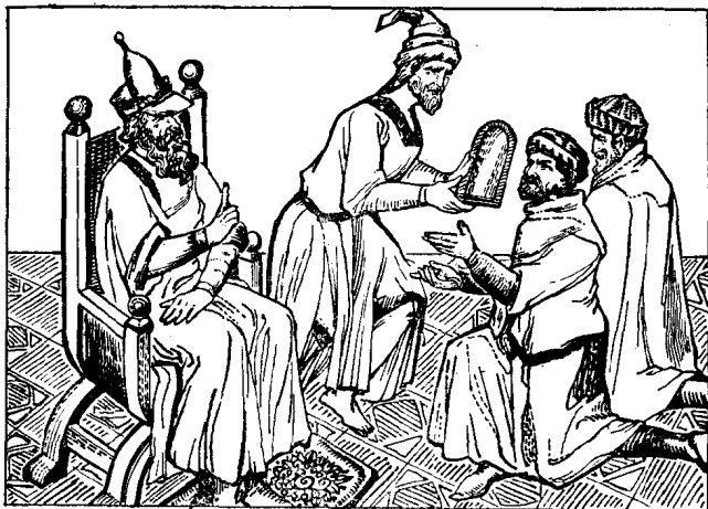
忽必烈大汗赐马可波罗等人通行的金牌

忽必烈命令部下准备船只和两年用的粮食，并在宫中召见马可波罗一行，赐以通行的两面金牌。1292