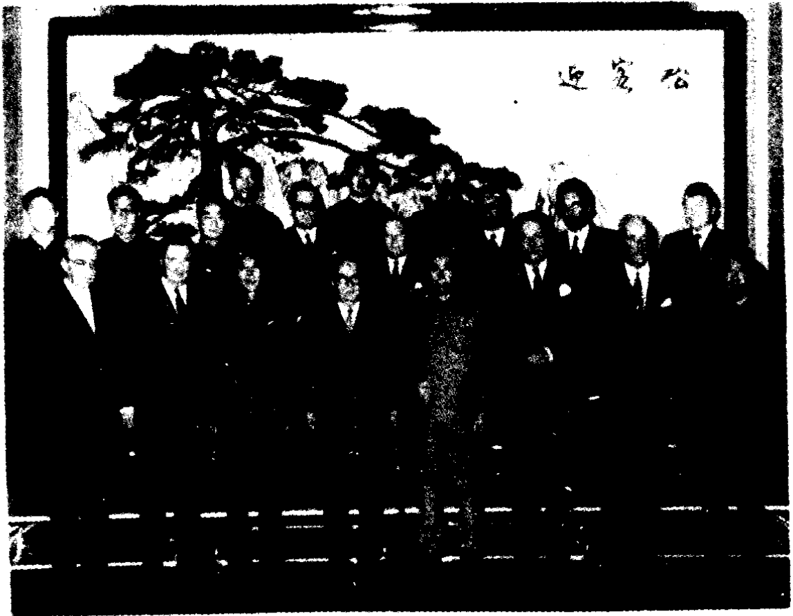
1972年周恩来(前排右四)接见赛林格(前排右五)

作为联邦商会的会长,我热烈地祝贺这本介绍奥地利、维也纳的书的中文版的出版,这部书是对增进奥中双边关系的巨大贡献。