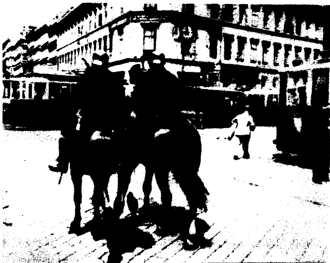
1934年德军铁蹄下的维也纳