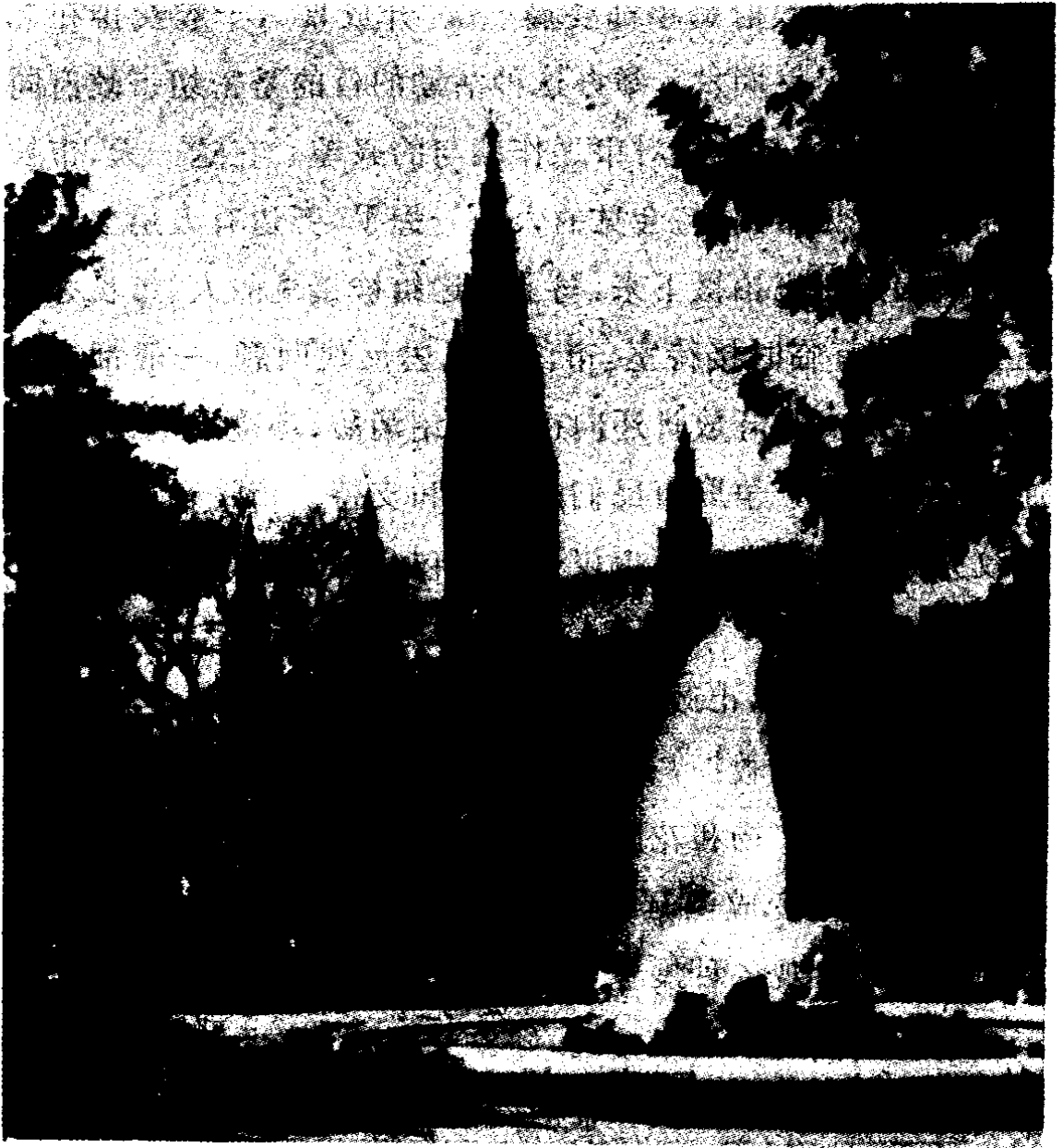
维也纳市政厅及街心花园

维也纳市政府设有一个市民服务站，其中心在市政厅，每一区都有分站。它的工作人员专门解决市民提出的问题、建议和他们的疾苦。迄今已收到 30 万份各种要求。维也纳市政府还建立了一种特殊的紧急措施办公室。凡是比较严重的问题，都由这个办公室的人员立刻用完全没有官僚气息的一种方式