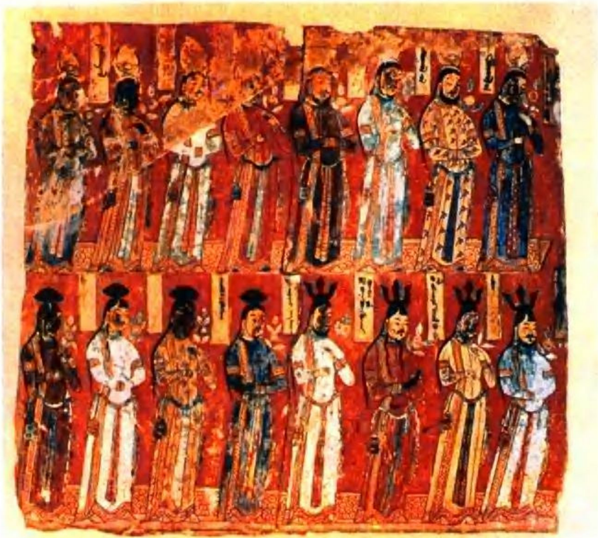
千佛洞壁画 回鹘上层人物群像