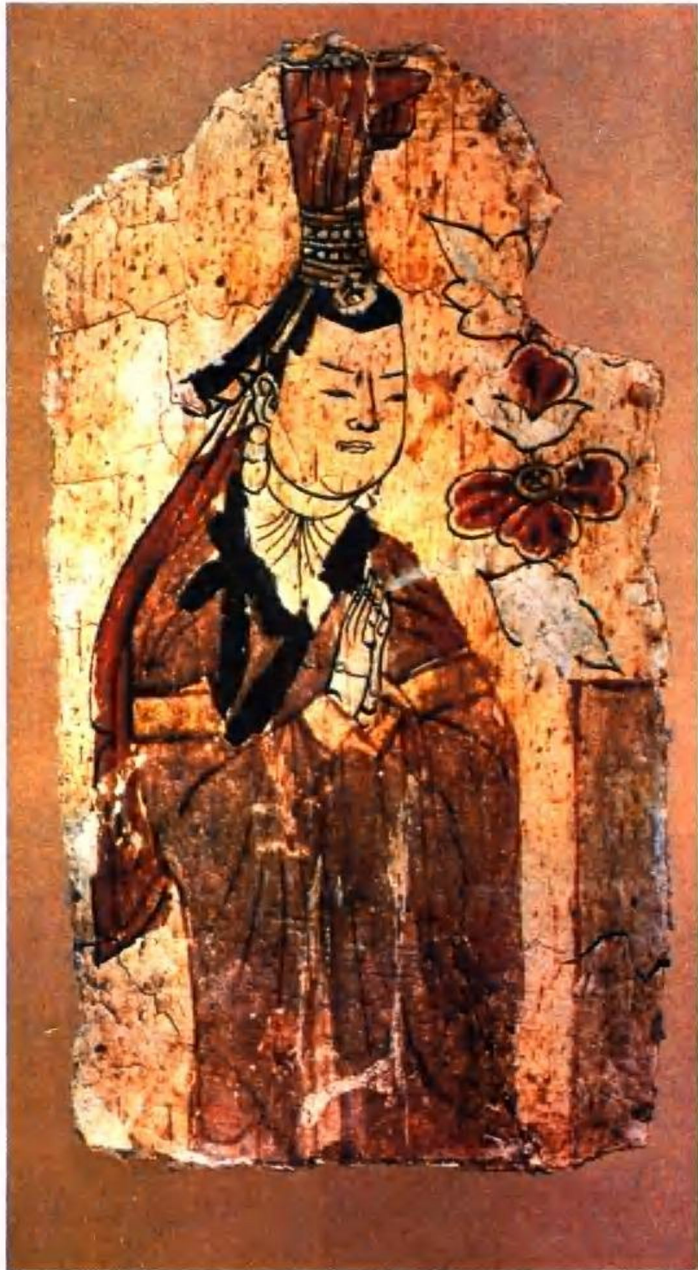
千佛洞壁画贵夫人供佛像