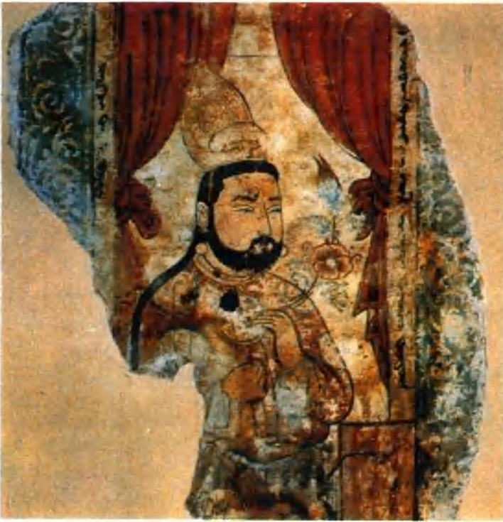
伯孜克里克千佛洞第37窟壁画 回鹘国王像