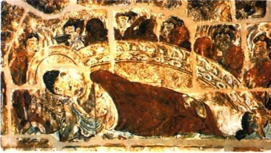
伯孜克里克千佛洞壁画涅槃图