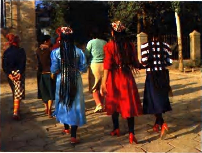
维吾尔少女的发式