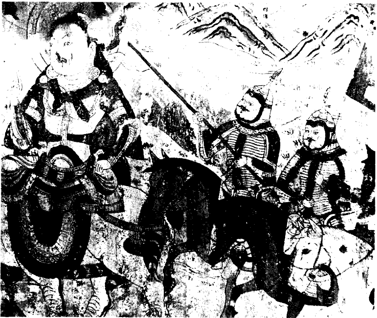
北庭古城西郊回鹘佛寺遗址中的壁画