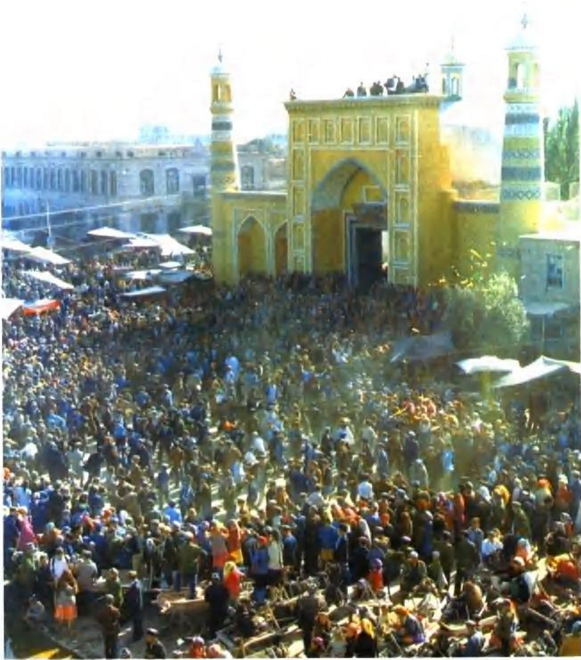
喀什艾提尔尔大清真寺