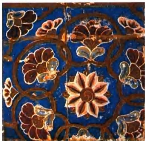
千佛洞壁画装饰图案