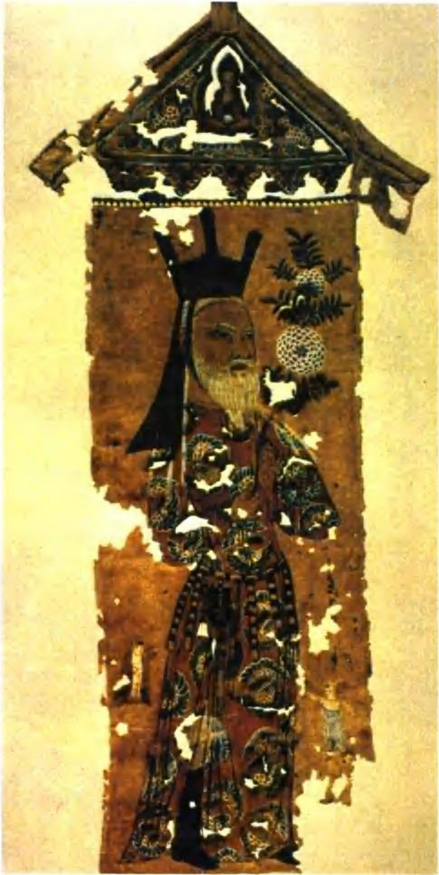
绢画供佛回鹘老者像