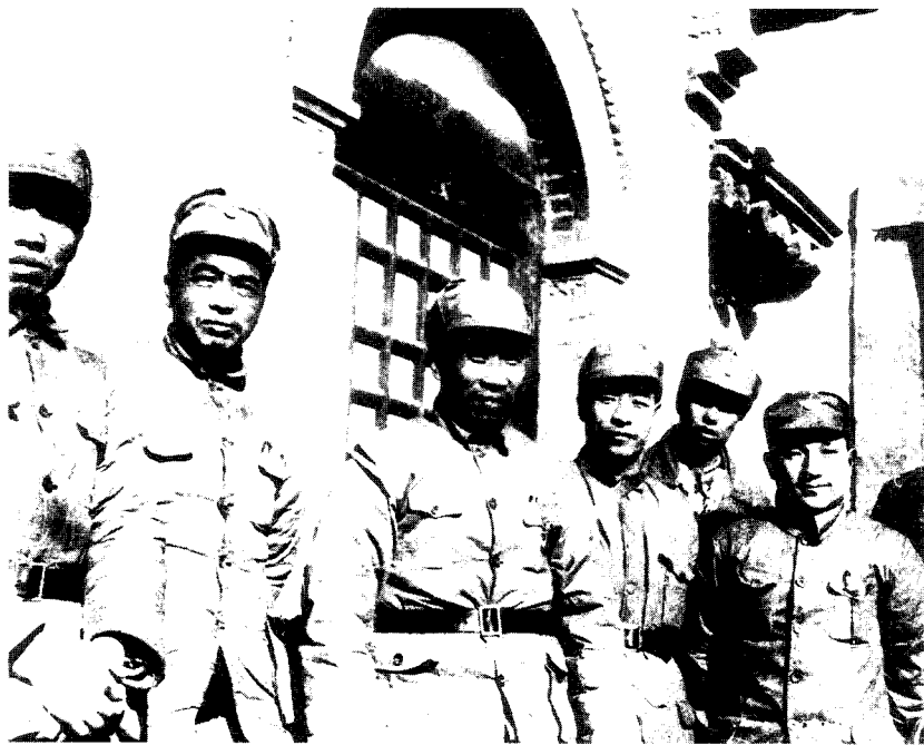
5 彭德怀与朱德、邓小平、彭雪枫、肖克等在山西武乡县王家峪八路军总部