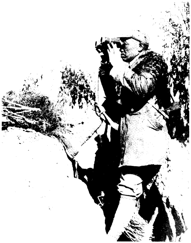
8 1940年“百团大战”时，彭德怀在山西武乡县关家垴前线哨所，此处距日军阵地500米