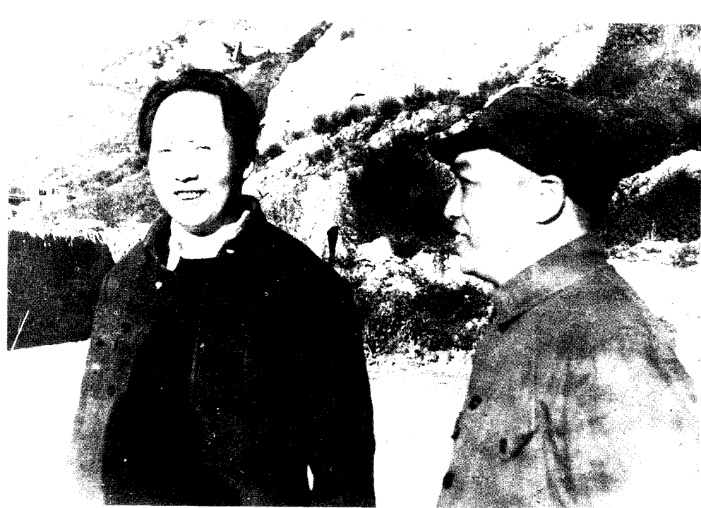
6 彭德怀与毛泽东在延安