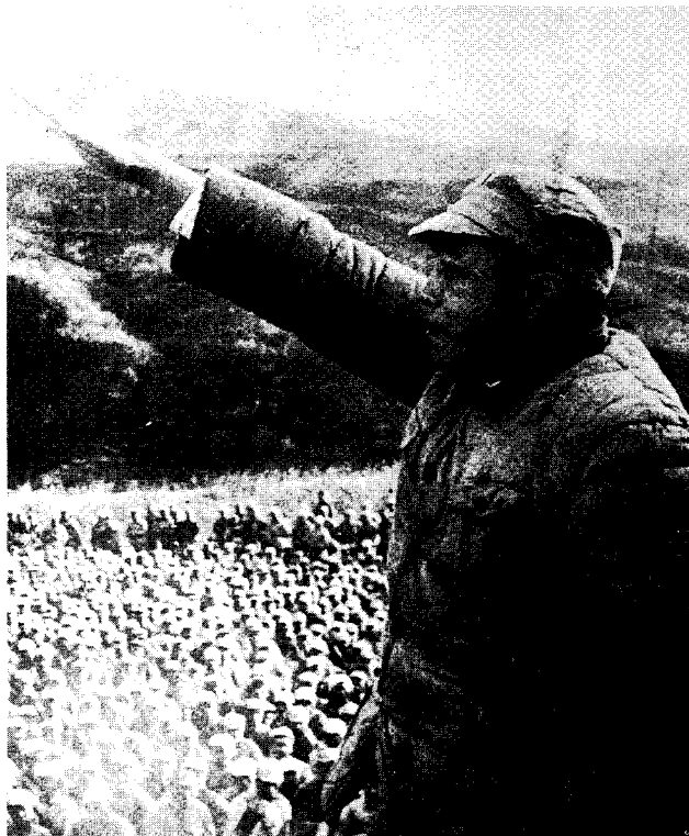
11 1947年3月，彭德怀在延安各界保卫延安群众大会上