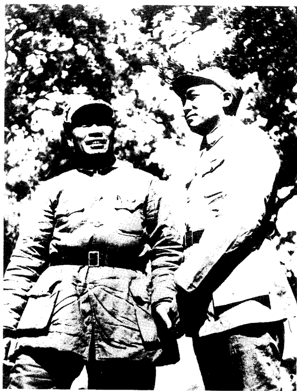
7 1939年，彭德怀和朱德在山西武乡县