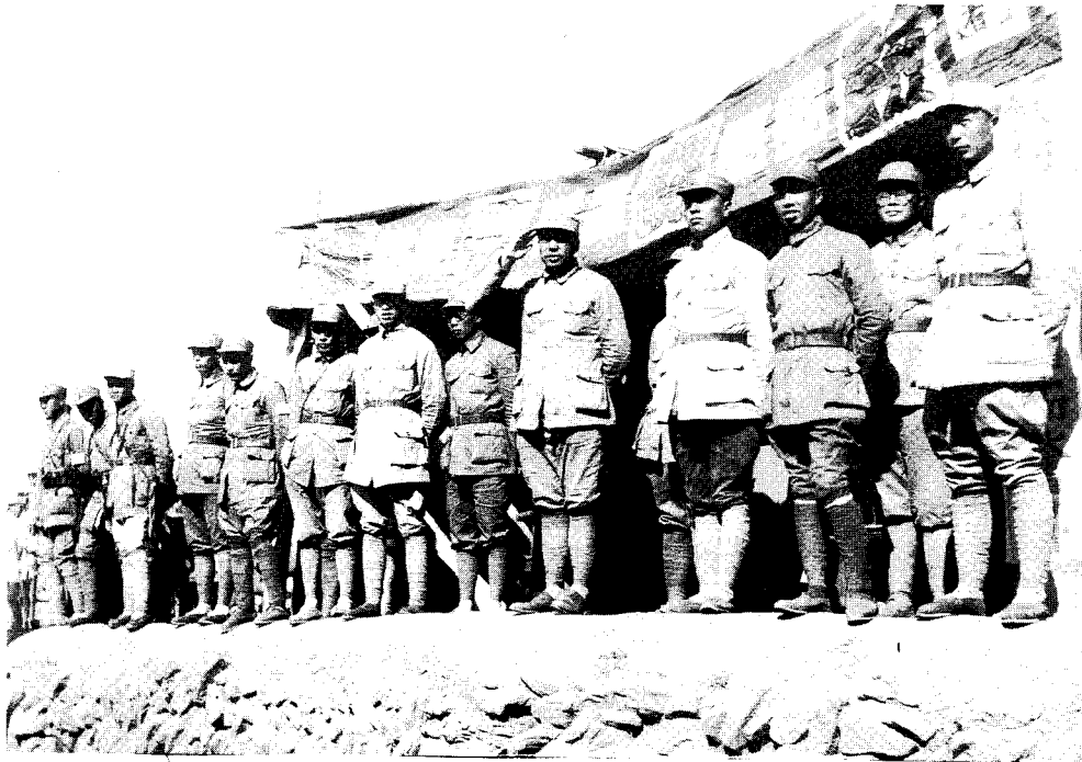
9 1940年春，彭德怀与聂荣臻、刘伯承、左权、杨尚昆、陆定一等在晋东南检阅部队