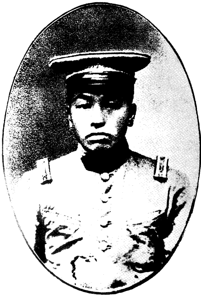
1 1923年，彭德怀在湖南陆军讲武堂学习，时年25岁