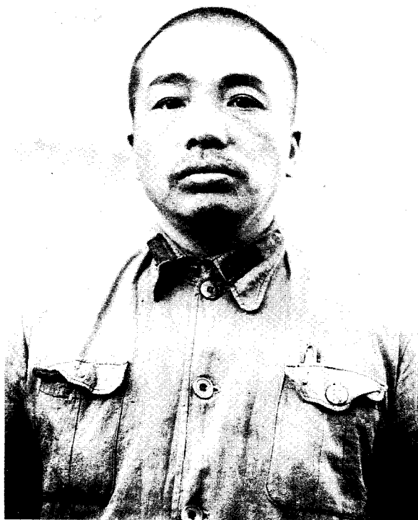
3 1937年1月，红军前敌总指挥彭德怀和任弼时（左四）、杨尚昆（左三）、陆定一（左五）等，与前来访问的国民党军将领在陕西三原县合影