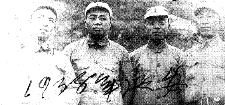
4 红三军团总指挥和三位政治委员(从左至右:李富春、彭德怀、杨尚昆、滕代远)