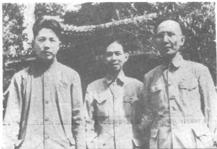
一九四九年七月第一次文代会期间与茅盾、周扬合影