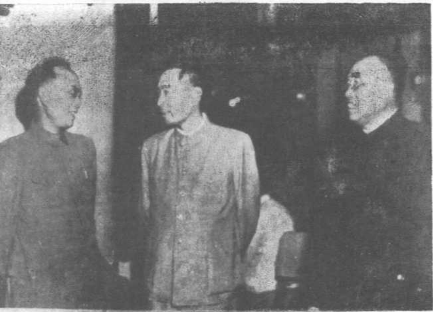
一九五四年与周恩来、朱德合影