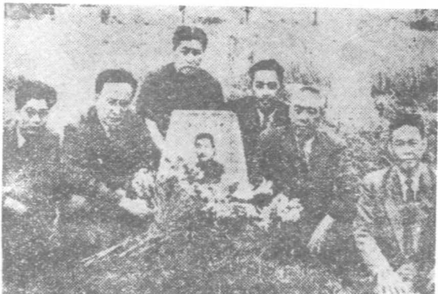
一九四六年十月与田汉、许广平等祭扫鲁迅墓