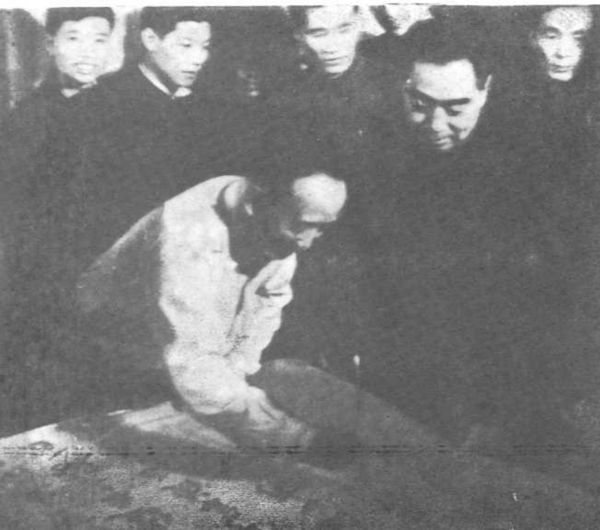
五十年代周恩来看郭沫若题诗