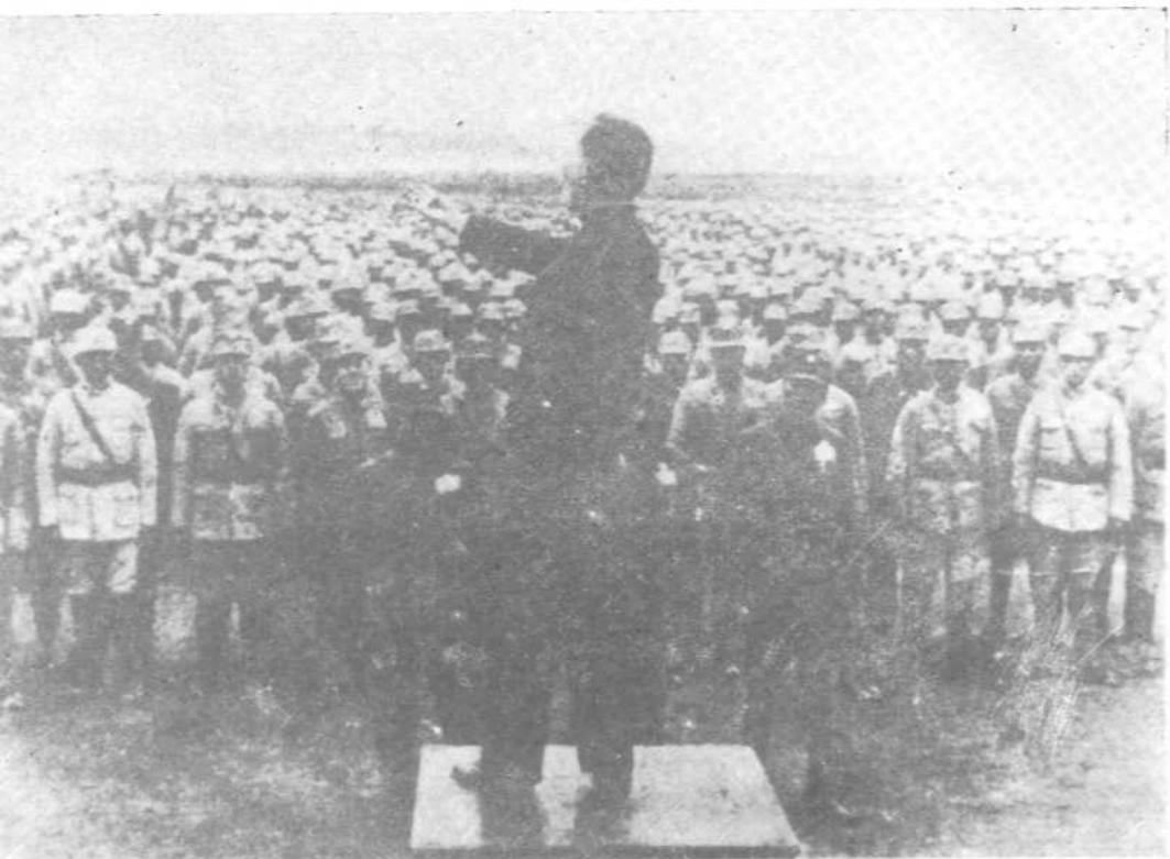
在抗日前线作慰问演讲