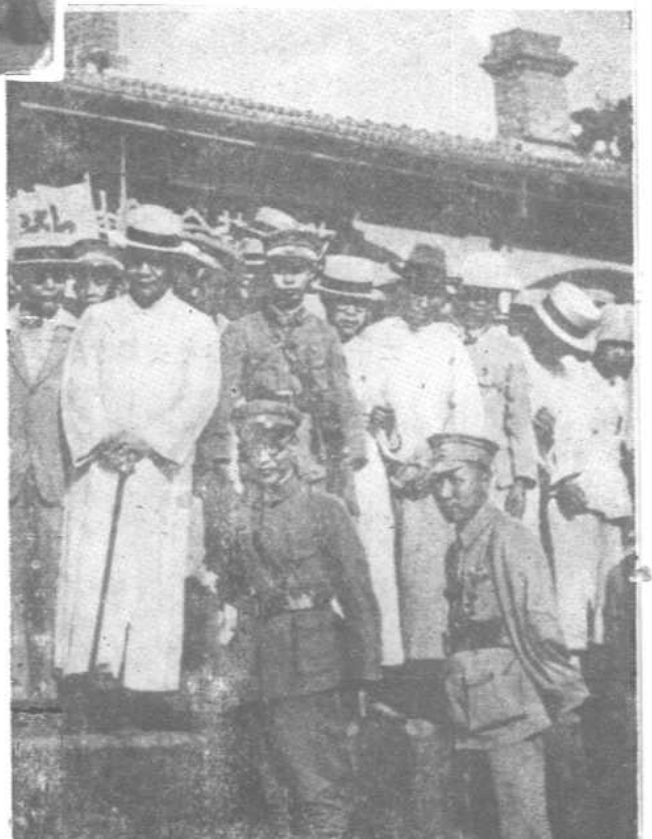
一九二七年春 摄于郑州车站 （前排左一为郭沫若）