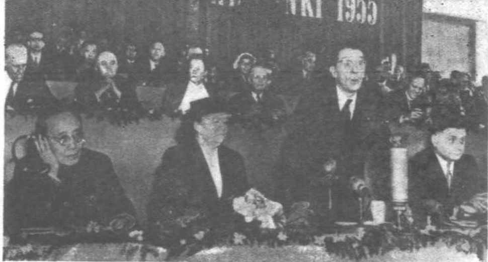
一九五五年六月二十二日与约里奥—居里 在芬兰赫尔辛基世界和平大会主席台上