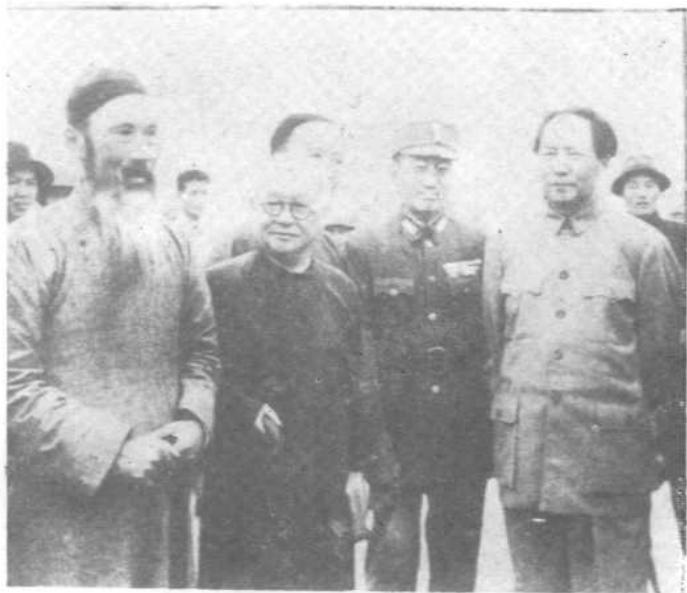
一九四五年在重庆与毛泽东、张治中、邵力子、 张澜合影