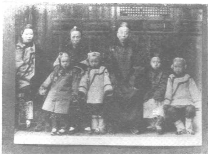
一八九七年在沙湾，父母、兄姐合影