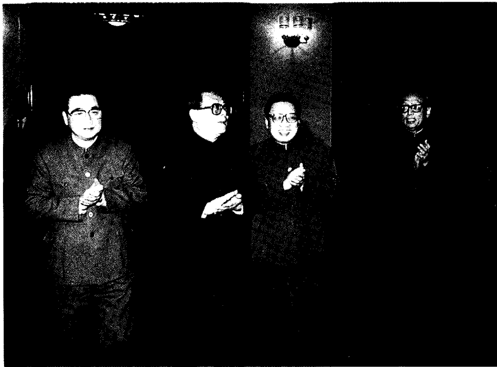
◆ 1990年1月6日上午，中央领导同志江泽民、李鹏、乔石在人民大会堂亲切会见了第十五次全国法院工作会议的代表。江泽民、李鹏同志作了重要讲话。