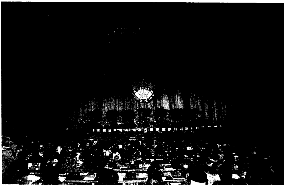
▶1990年4月28日第十四届世界法律大会在北京人民大会堂隆重召开。◀