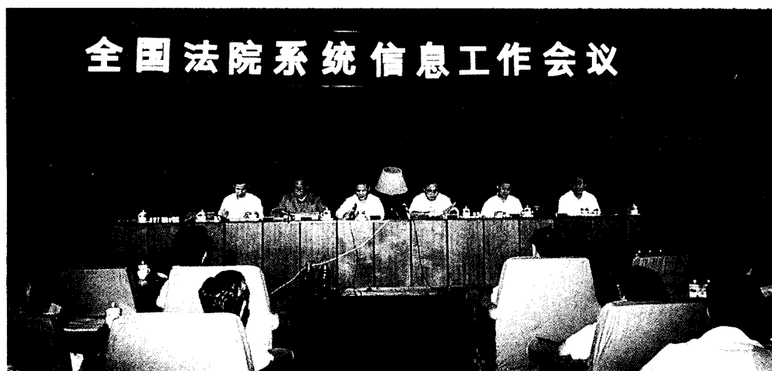
▲ 1990年6月8日至10日，全国法院系统信息工作会议在湖南省长沙市召开。