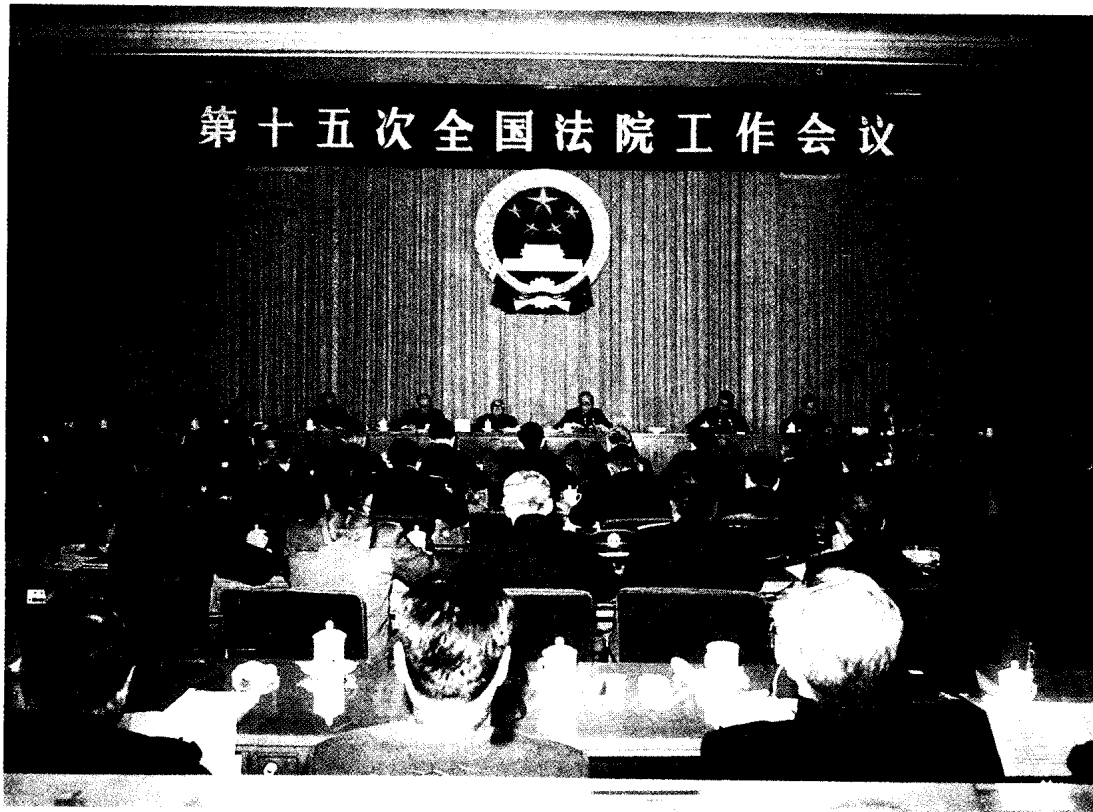
◆ 1990年1月4日，第十五次全国法院工作会议在北京人民大会堂隆重召开。