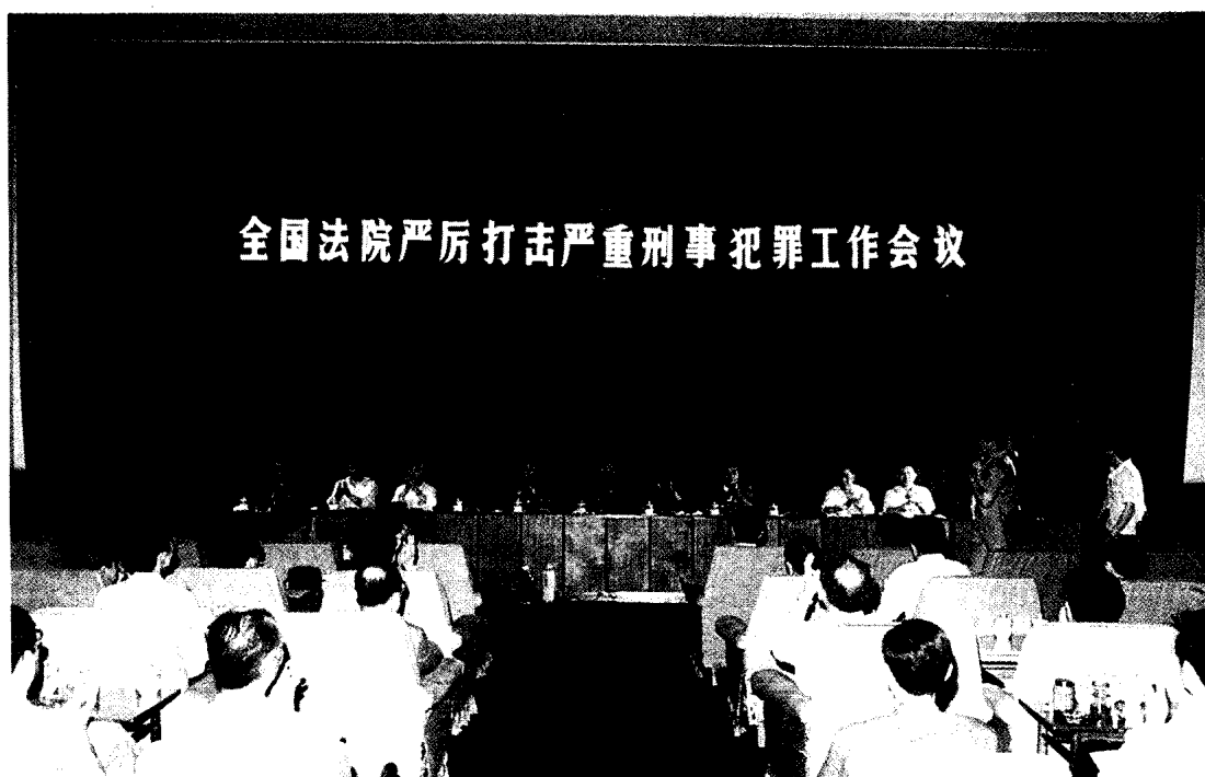
▲ 1990年6月11日至13日，全国法院严厉打击严重刑事犯罪工作会议在湖南省长沙市召开。