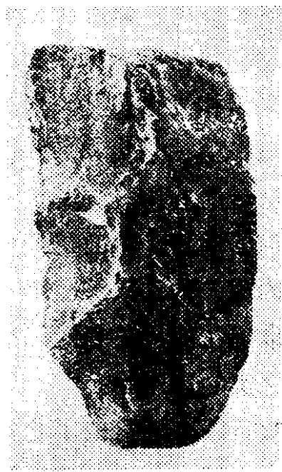
砍砸器 (周口店出土)

在周口店北京人居住洞穴的外面，发现了用火烧过的灰层和兽骨；在洞穴的里面，也发现了一堆堆很厚的灰烬、木炭、烧骨和朴树籽，这是北京人用火的遗迹。北京人破天荒地在亚洲大陆