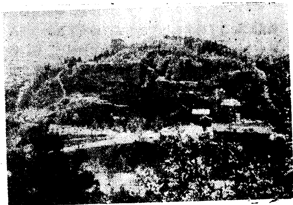
北京周口店龙骨山全貌

北京人居住在周口店龙骨山北坡的山洞中，那里遗留着他们的骸骨化石，使用过的工具，用火的遗迹和大批哺乳动物的化石。这是一座打开人类起源之谜的历史宝库。