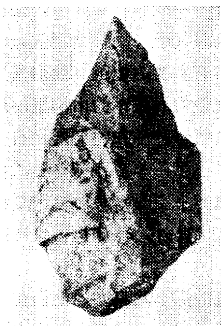
尖状器 (周口店出土)

北京人所处的时代，在人类经济文化史上属于旧石器时代初期。他们的石器是用原始的打制方法制成的，技术还不大熟练。他们在附近的河滩上选取石英岩、绿色沙岩、火石等作原料，做成各种形状的石器，最大的是厚刃砍伐器，较小的有双刃尖状器，还有刃部锋利的刮削器和两端刃器等。这些工具分别用于砍伐树木，刮削兽皮和切割兽肉，同时也用作狩猎的武器。北京人在辛勤劳动和艰苦斗争中不断获得进步。