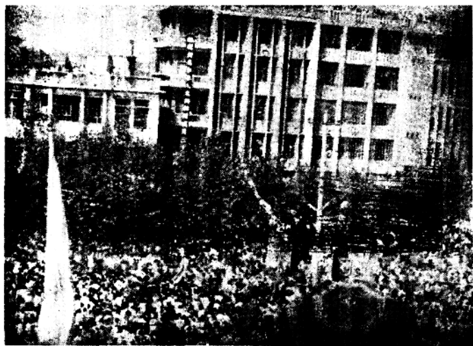
庆祝冷水滩市恢复盛况