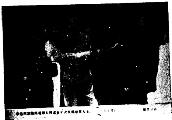
李达同志陪同毛泽东同志会见武汉科学界人士