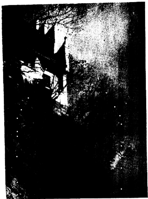
文 昌 閣