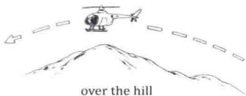
over the hill 飞越山岗