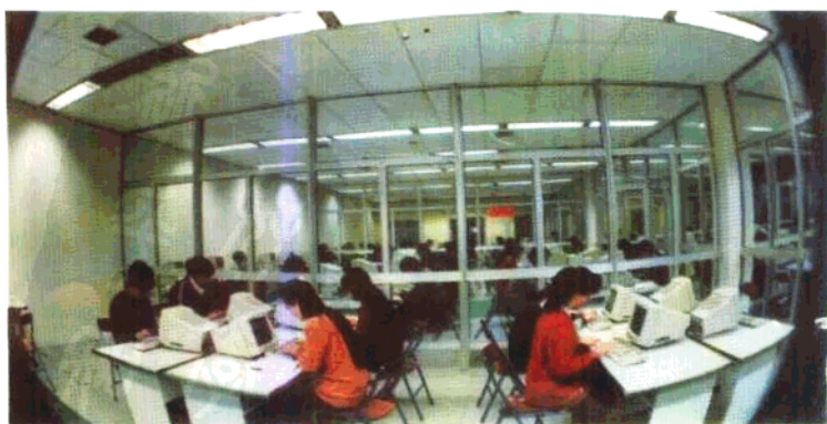
►学生 在计算机中 心上机