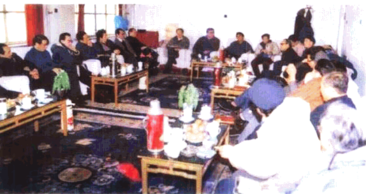
◀学校 专职兼职教 授在讨论学 校发展大计