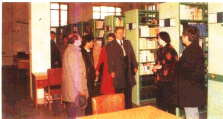
►全 苏石油学 会代表团 参观图书 馆