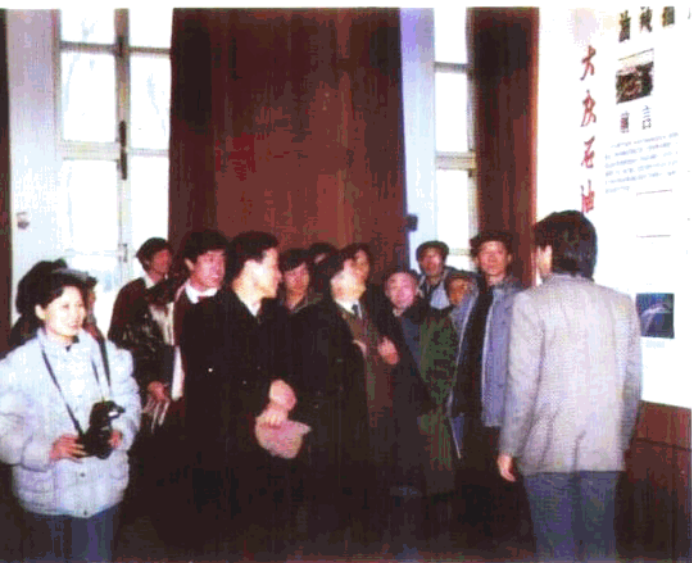
◀石油天然气总公司领导、大庆市委领导参观学校科技展览