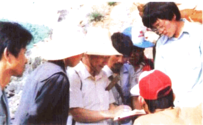
◀石油天然气 总公司人教局尹道 默副局长检查学生 地质实习