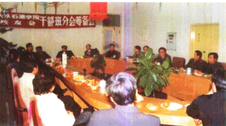
◀校 友会分会 筹备会