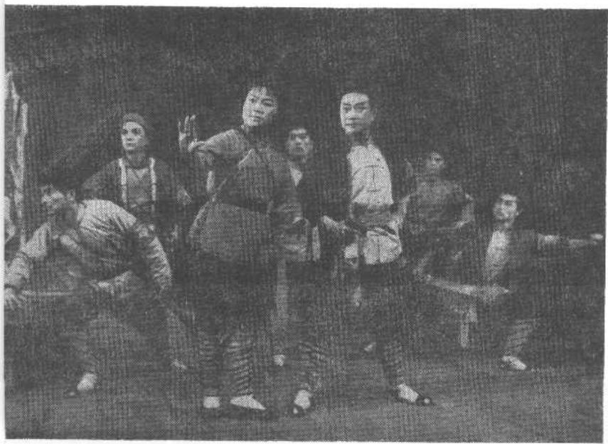
第 二 场