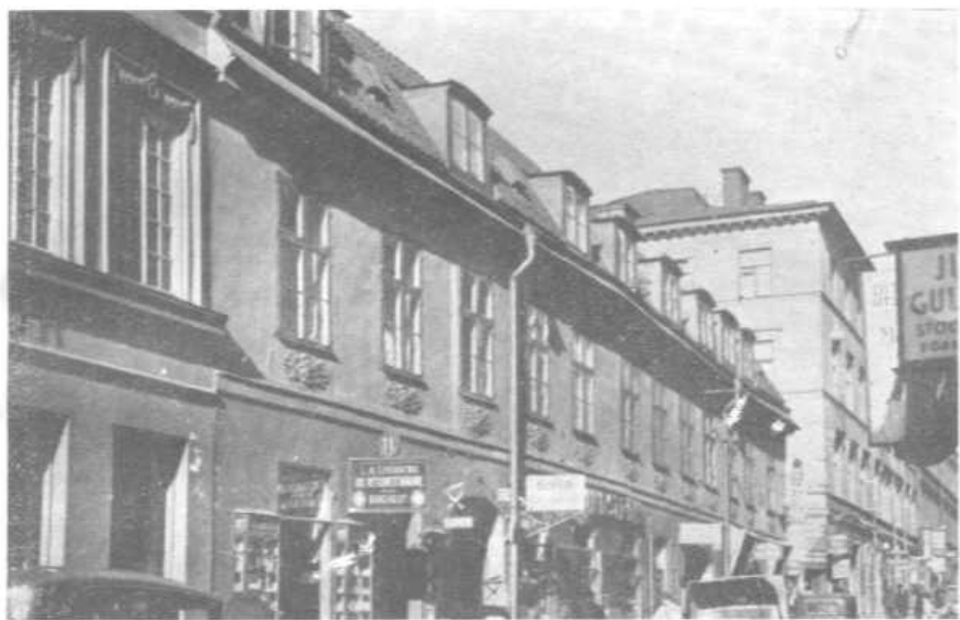
诺贝尔出生地斯德哥尔摩北方街11号