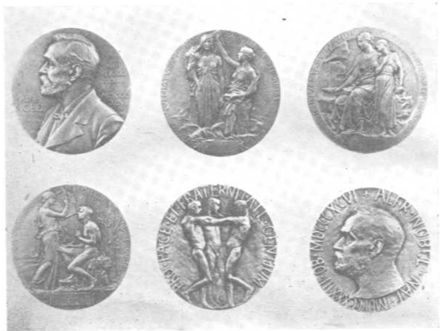
各类诺贝尔奖章的正面和背面