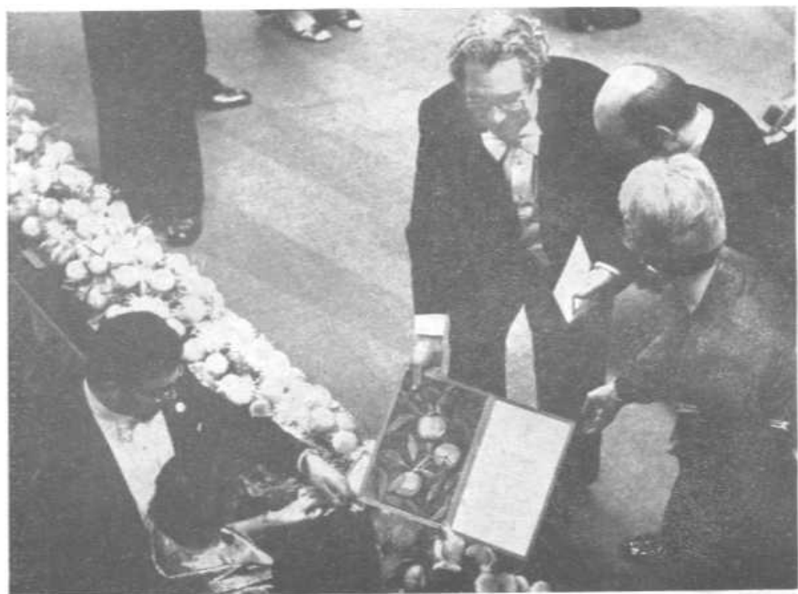
诺贝尔奖金颁发仪式