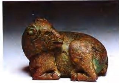
错金银铜羊(汉代) 鎏金铜牛(西夏)