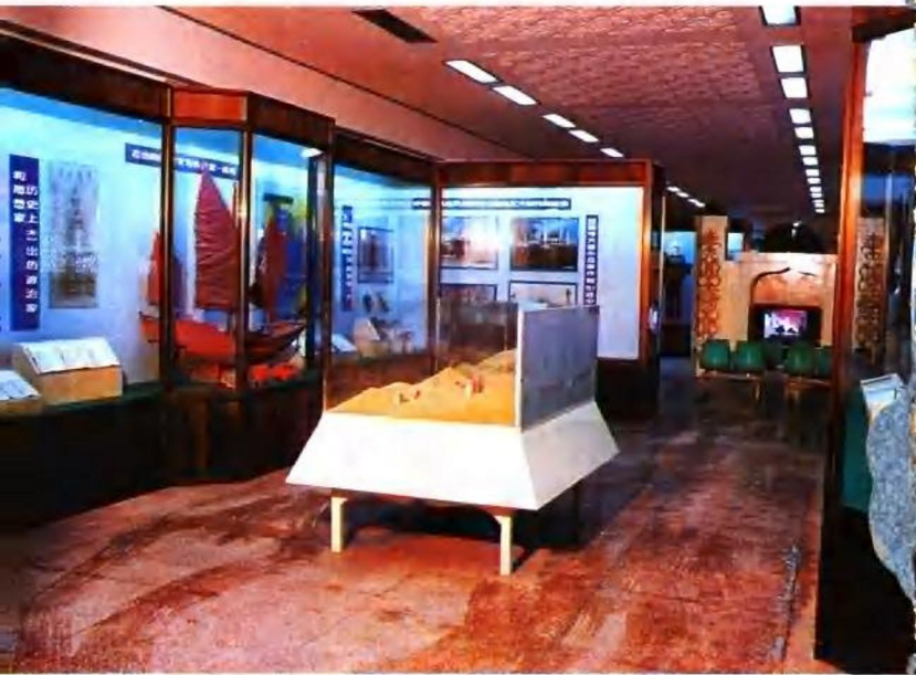
回族文物习俗展厅