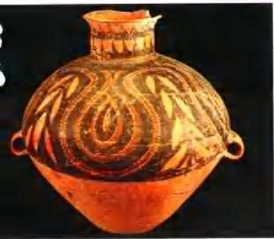
彩陶罐(新石器时代) 西夏文残碑(西夏)