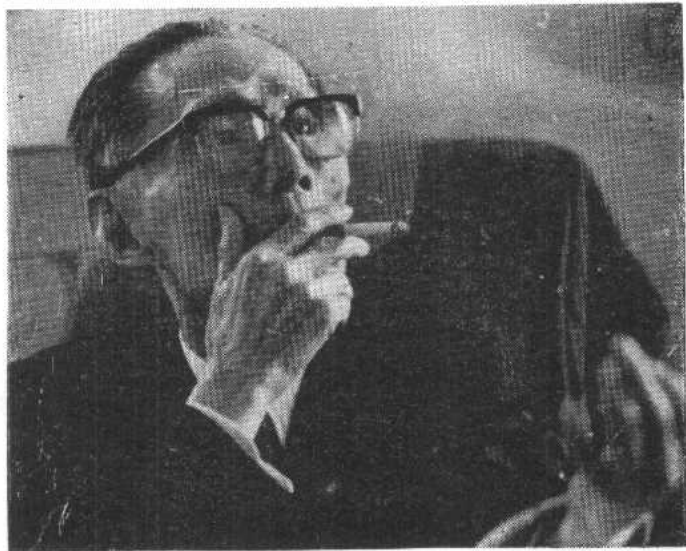
夏衍1987年春于杭州汪庄