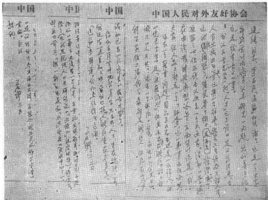
夏衍关于人才问题的通信手迹