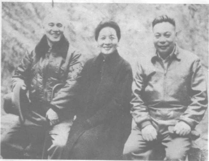
蒋介石与夫人宋美龄、长子蒋经国在台湾横贯公路合影。