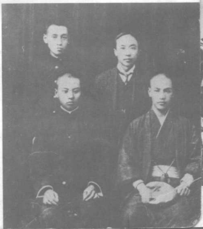
蒋介石（前排右） 与留日同学张群（前排左） 等在东京合影。(1911年摄)