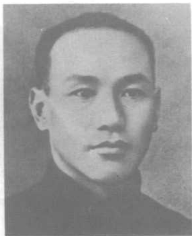
蒋介石17岁就读于凤麓学堂。