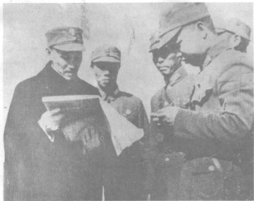
1937年8月13日淞沪抗战爆发，蒋介石在前线视察。