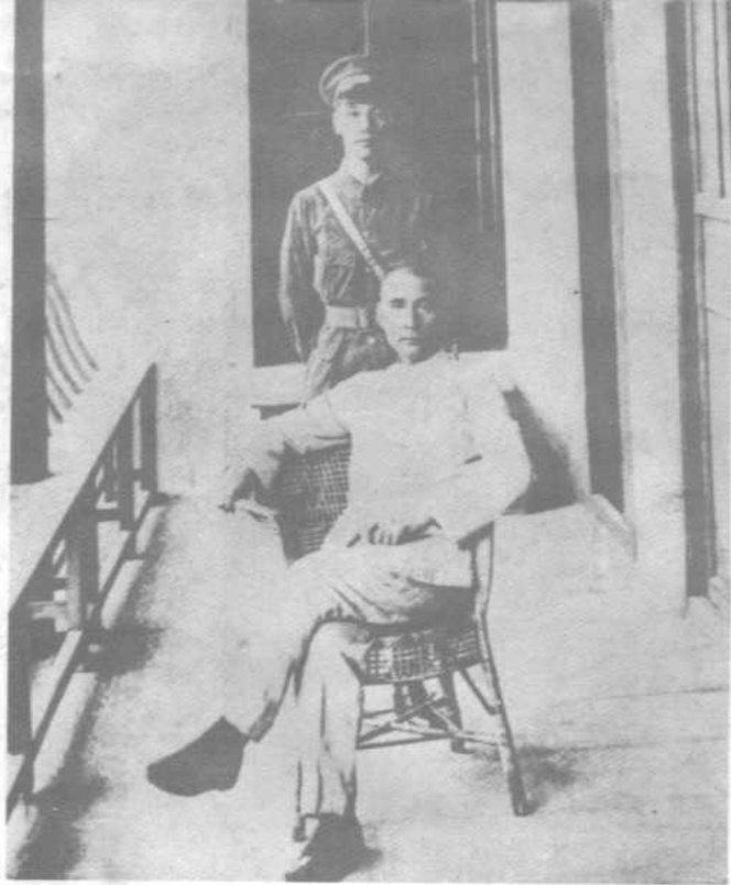
任北伐军总司令时的蒋介石。(一九二六年摄)