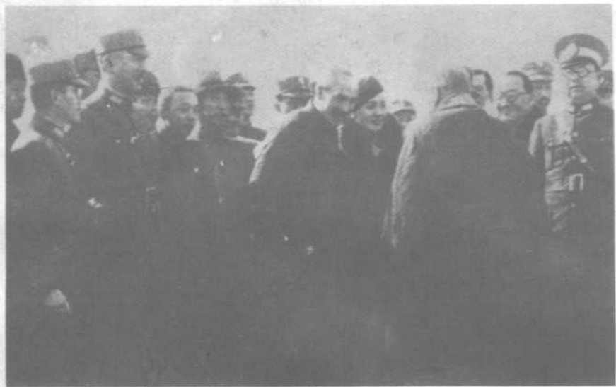
西安事变和平解决，蒋介石于12月26日从西安回到南京。