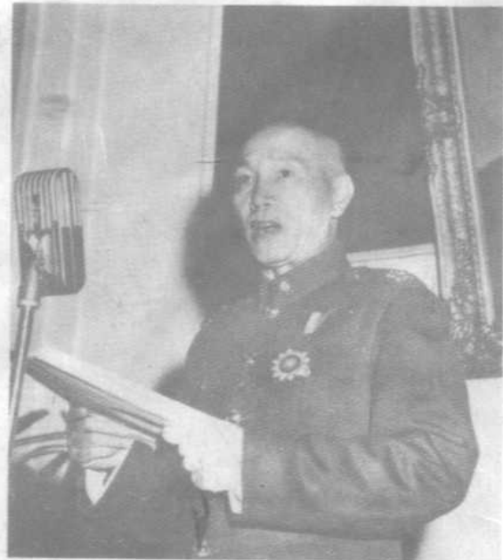
1950年3月1日，蒋介石 在台北宣布复任总统。