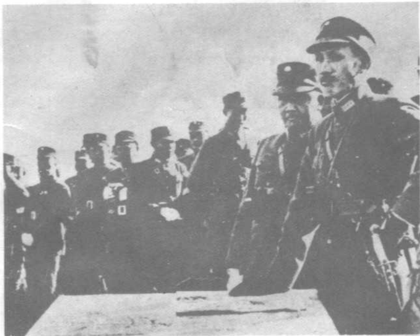
蒋介石在“围剿”前线督阵。