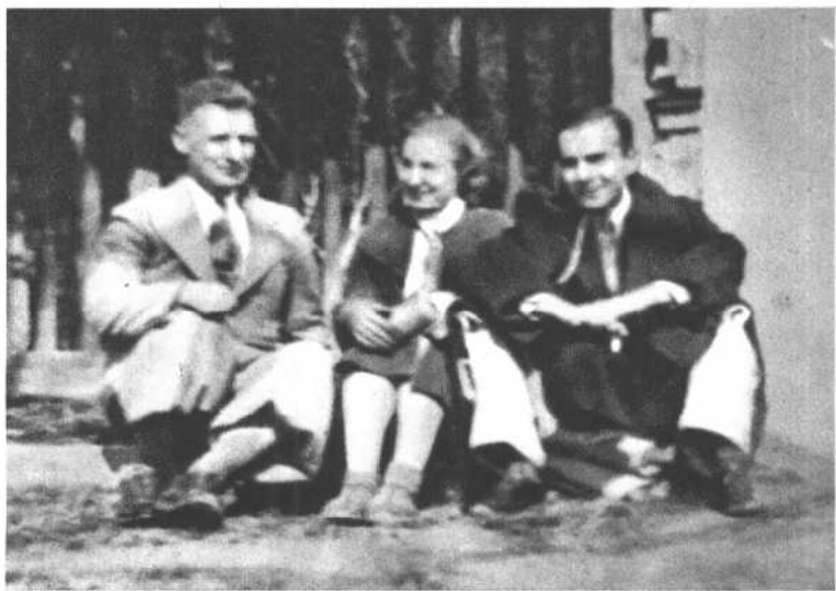
王安娜与埃德加·斯诺(右)、路易·艾黎(左)