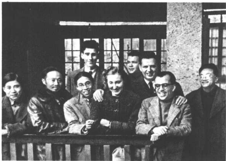
王安娜与李公朴(左二)、茅盾(左三)、爱泼斯坦(左五)、 章汉夫(左六)等在重庆(一九四四年)