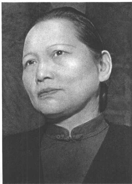
宋庆龄 (一九四六年)