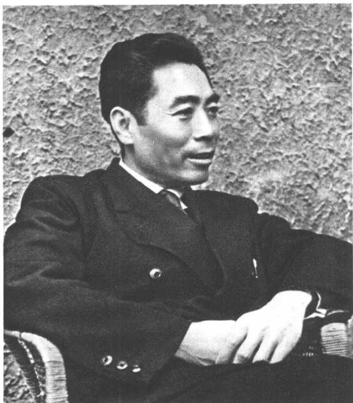
周 恩 来 (一九四六年)