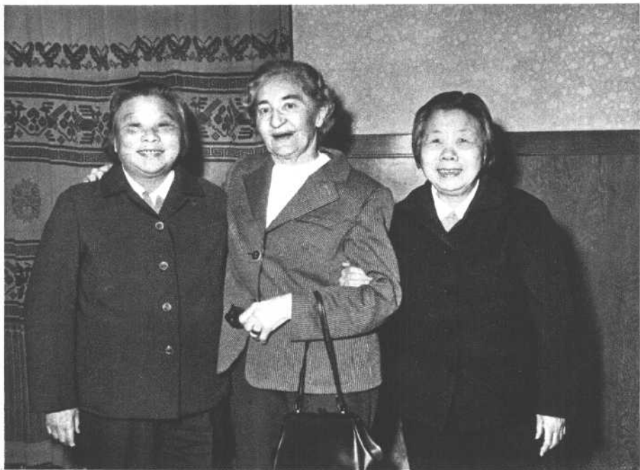
邓颖超、康克清同志亲切会见王安娜（一九七九年）