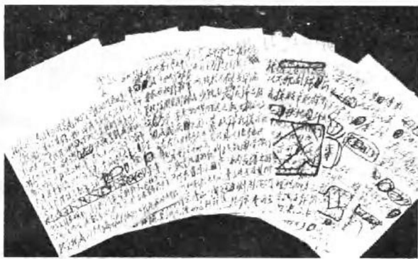
图1 毛泽东关于辽沈战役的作战方针电报手稿

波指挥千里之外的辽宁西部及沈阳地区的人民解放军作战(图1)。辽沈前线在东北野战军司令员林彪和政治委员罗荣桓的直接指挥下,采用奔袭战、阵地战、攻坚战、围困战和运动战战术,一鼓作气,经过三次大会战,历时52天,成功地演绎了一场以我军胜利而告结束的战略决战。我军首歼锦州范汉杰集团,次歼辽西廖耀湘兵团,再歼沈阳周福成集团,一口气吃掉东北卫立煌集团,共歼敌47.2万余人。这样一个巨大的数字,震动了中国,也震动了世界,美国再也不相信蒋介石了。从此,违背人民意愿的蒋介石国民党军队败局已定,中国人民的胜利在望。