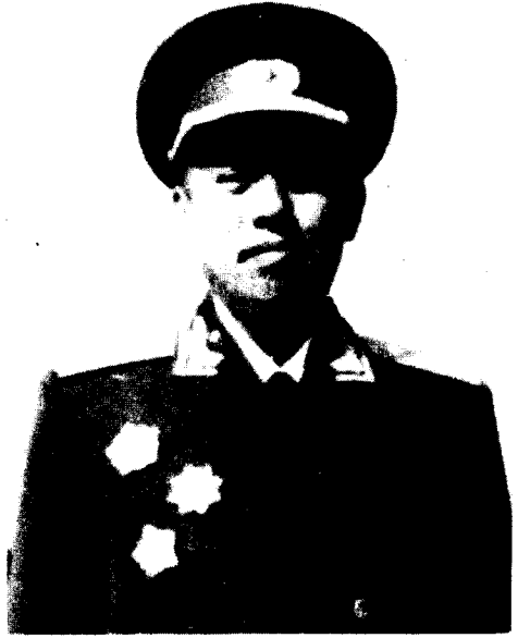
陈 伯 钧