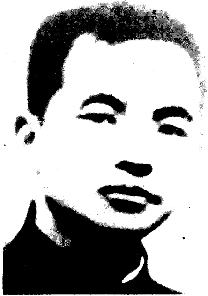
邓 中 夏