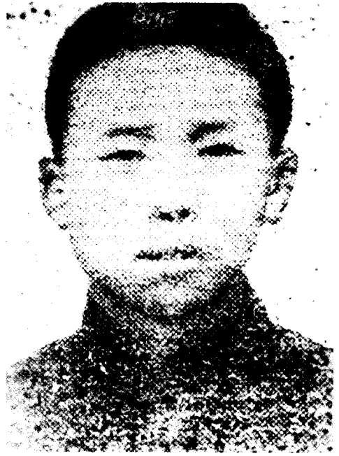
叶 天 底