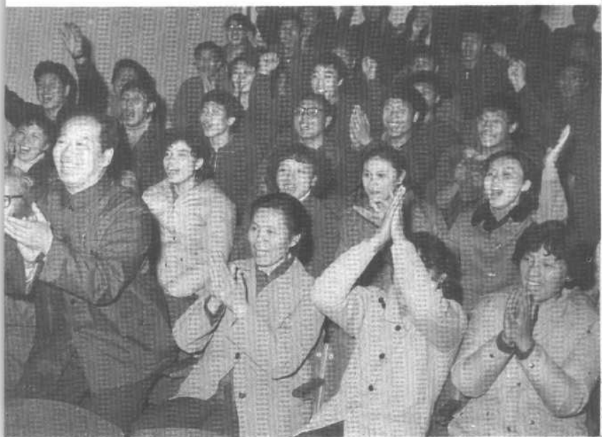
平平为国争了光（郎平父母观看排球比赛）