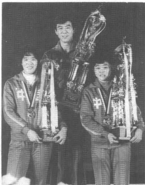
中国女排全体合影