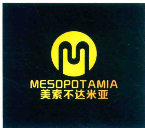
美索不达米亚社群