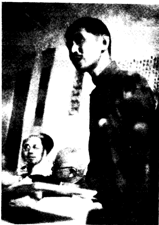
一九四五年在五十寿辰会上