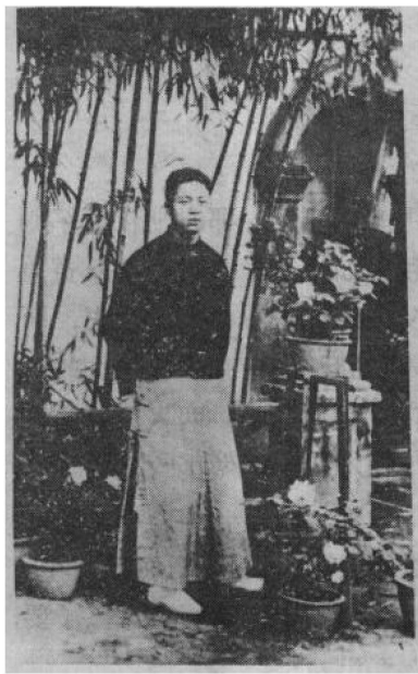
从家乡出走前的吴晗

1926年，吴晗转到第四小学教高小。这时他仍然怀着强烈的升学愿望。他听说广州有个黄埔军校，颇有名声，而且上学不花钱，就打算到广州去。可是由于筹不出路费，