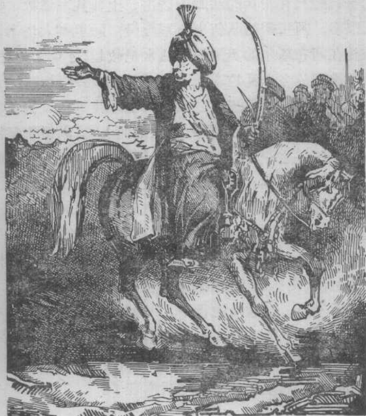
骄横残暴的马穆鲁克首领