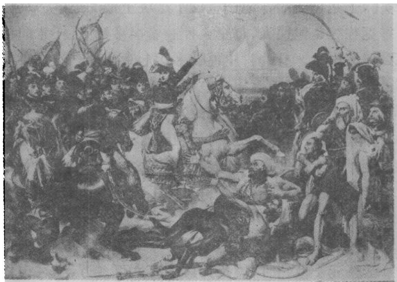
一七九八年，拿破仑入侵埃及，马穆鲁克溃不成军

人民再也不能忍受这种生活了。结束苛政，抵御外侮是埃及人民长期以来的愿望。在统治阶级中也有