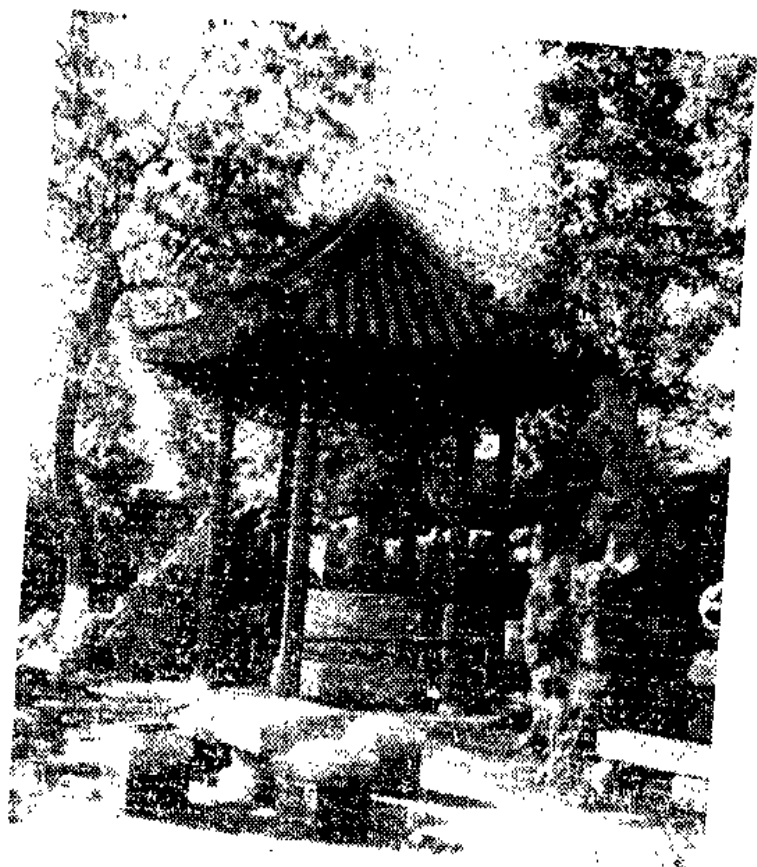
雪 浪 石