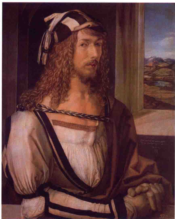
图5 丢勒（德国）《26岁的自画像》41cm×52cm 1498 木板油画