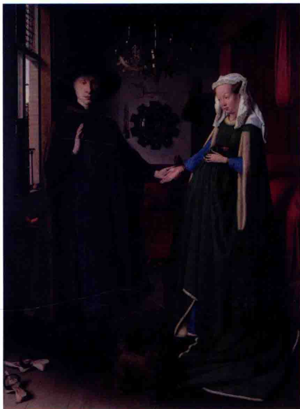
图4 凡·艾克（尼德兰）《乔瓦尼·阿尔诺芬尼夫妇像》60cm×80cm 1434 油性坦培拉混合技法 木板油画