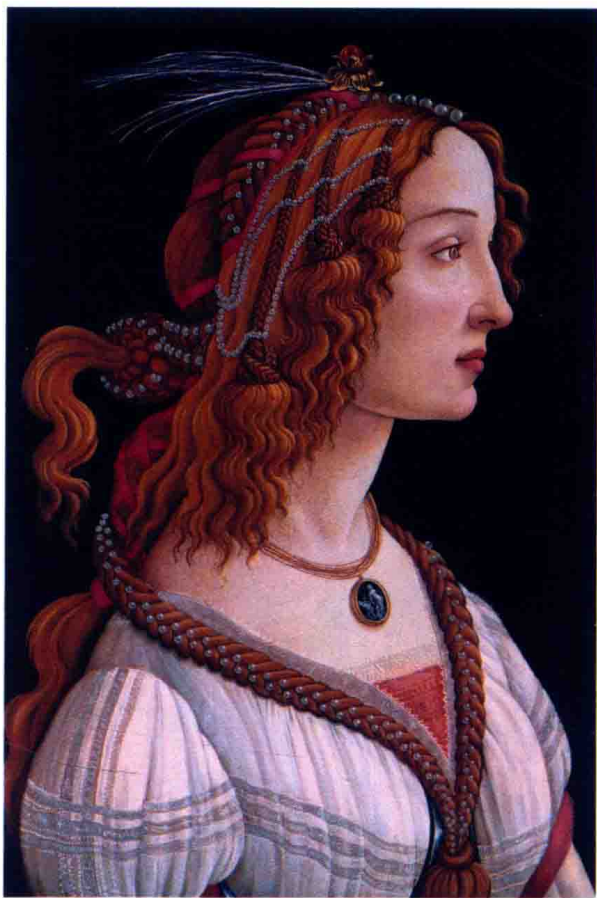
图2 波堤切利（意大利）《女子肖像》1480—1485 木板坦培拉

操作上程序较为烦琐，又难以达到细微的写实风格。另外，蛋彩本身难以抵御潮湿等缺点，随着画家对画面真实性的追求，坦培拉技法已经不能满足画家作画的需求，于是画家纷纷寻求更为理想的绘画材料的制作方法。油性媒介材料与技法形成的历史功绩主要应归于15世纪的尼德兰—弗拉芒画派（又作佛兰德斯画派），凡·艾克（Jan Van Eyck 1395—1441）则是其中的代表性画家，他的作品在造型上准确严谨、色彩透明和谐、明暗层次的丰富变化和材料与技法运用的精致纯熟是其他画家所达不到的（图3、图4），正