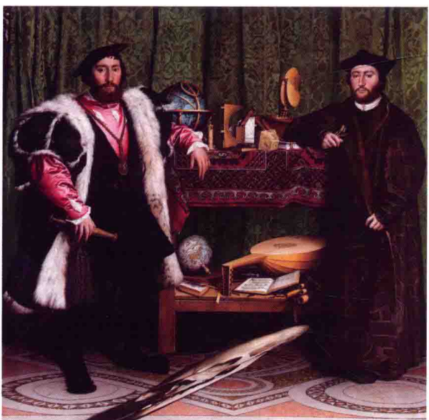
图6 荷尔拜因（德国）《两个使节》209.5cm×207cm 1533 橡木油画

也是各具特色（图7、图8）。而使这一材料技法进一步向油性颜料发展并做出重大贡献的是意大利北方的威尼斯画派，威尼斯画派发展了混合技法，以乔凡尼·贝利尼（Giovanni Bellini