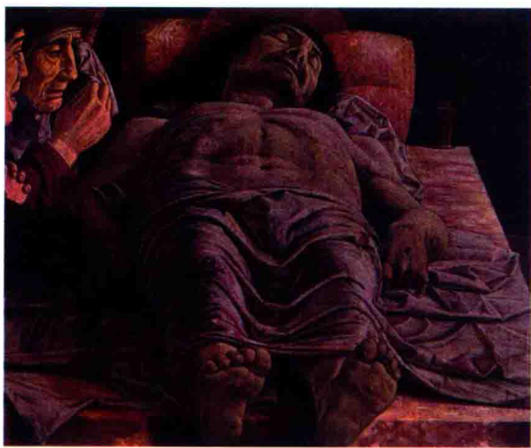
图1 安德烈·曼特尼亚（意大利）《哀悼基督》66cm×81cm 1475—1478 木板坦培拉

在油画诞生以前的欧洲画家主要是以“坦培拉”（Tempera）技法来进行架上绘画。这是一种用蛋黄来调和色粉颜料，画在涂有石膏底子的木板上的绘画技术，故也称作“蛋彩画”。但是“坦培拉”的概念并不仅仅局限于蛋彩画，它是指使用含有水分和油性混合乳剂物质做颜料结合剂来作画的一种绘画技法与材料体系，只有使用鸡蛋乳液作为绘画媒介剂材料的才专指蛋彩画。13—14世纪时，蛋彩坦培拉技法已经十分完善，成为油画诞生前欧洲架上绘画的主要技法。因此被画家广泛应用，意大利文艺复兴早期大师安德烈亚·曼特尼亚（1431—1506）和波堤切利（1445—1510）使用坦培拉绘画已达到登峰造极的地步，留下了大量精彩的杰作（图1、图2）。但是蛋彩画也有其局限性，由于蛋彩干得很快，