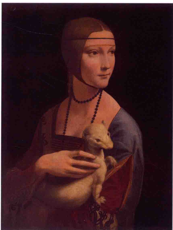
图7 达·芬奇（意大利）《抱银鼠的女子》40.3cm×54.8cm 1483—1490 木板油画

西班牙画家埃尔·格列柯（El Greco 1541—1641）早年受到提香影响，但他在继承意大利油