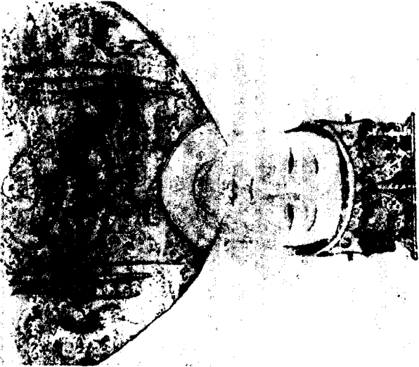
后 武 唐