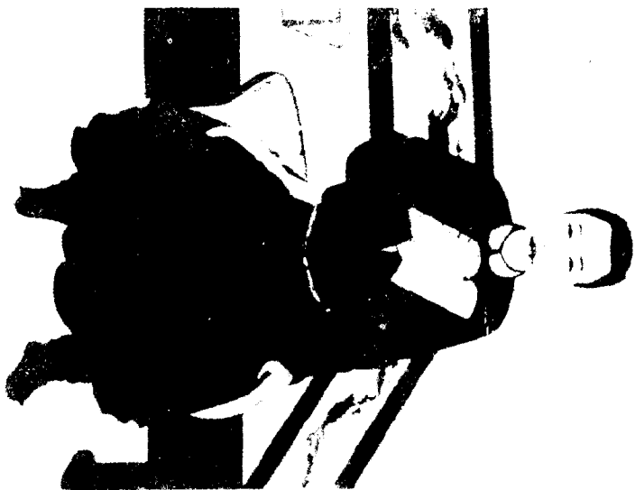
清 世 宗