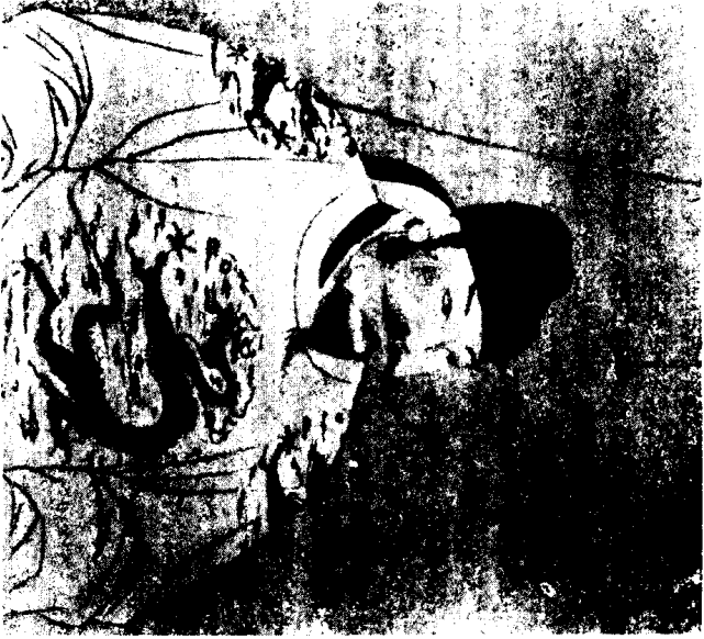
宗 太 唐