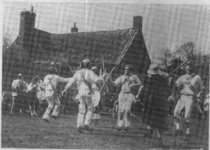
▷ 乡村里的莫里斯土风舞