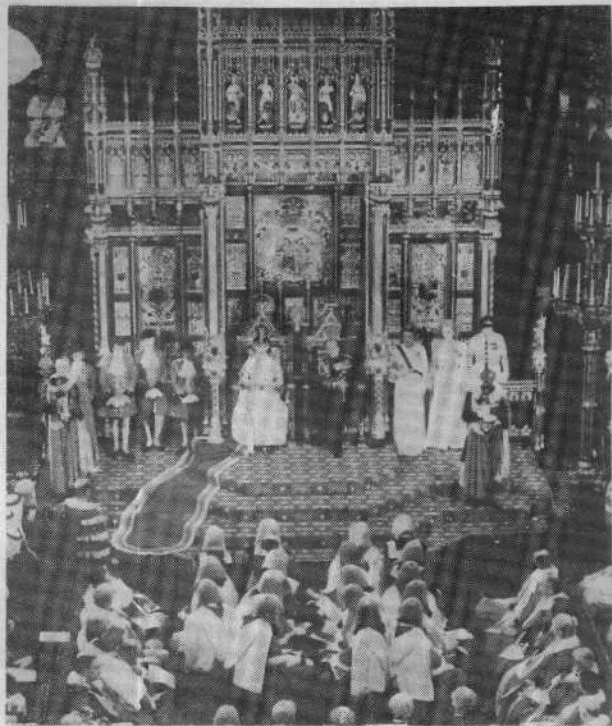
▷ 国会开幕，女王亲临致词