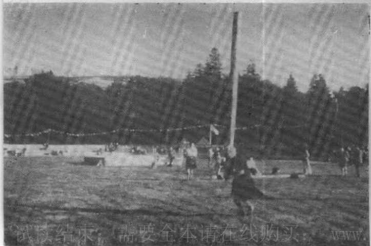
◁ 苏格兰传统民族运动——抛树干