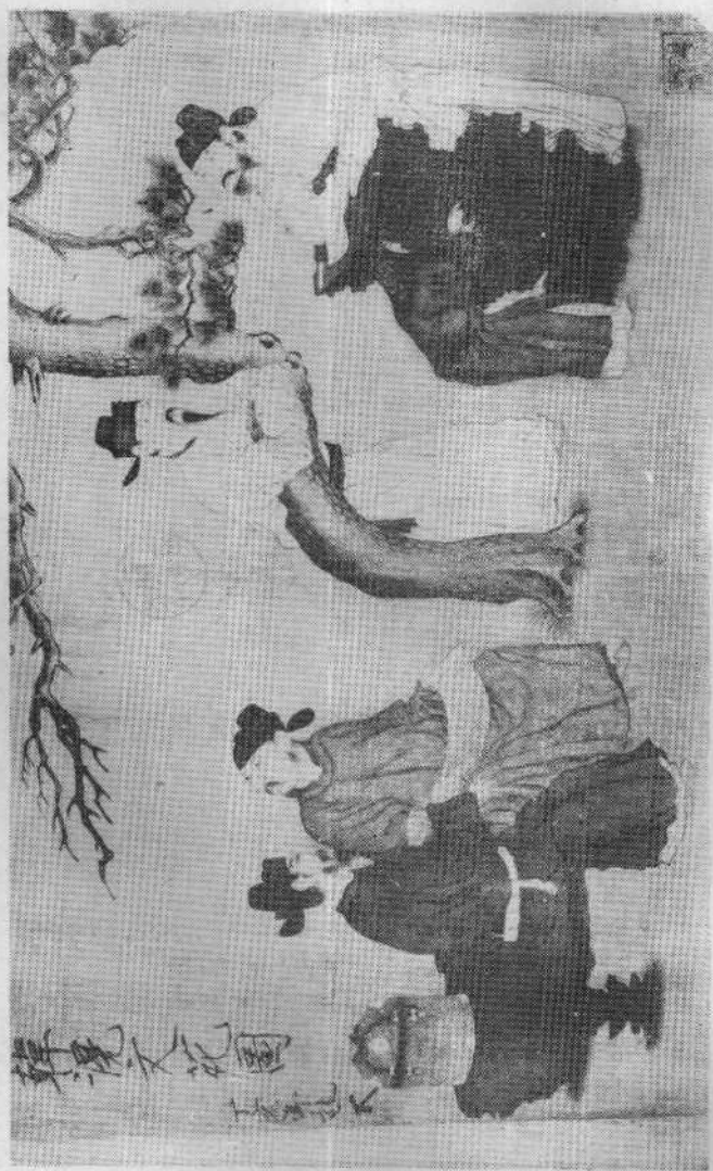
图四 [唐]韩槐《文苑图》