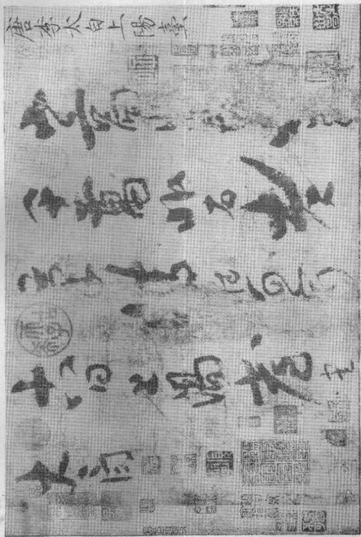
图一 〔唐〕李白《上阳台》墨迹