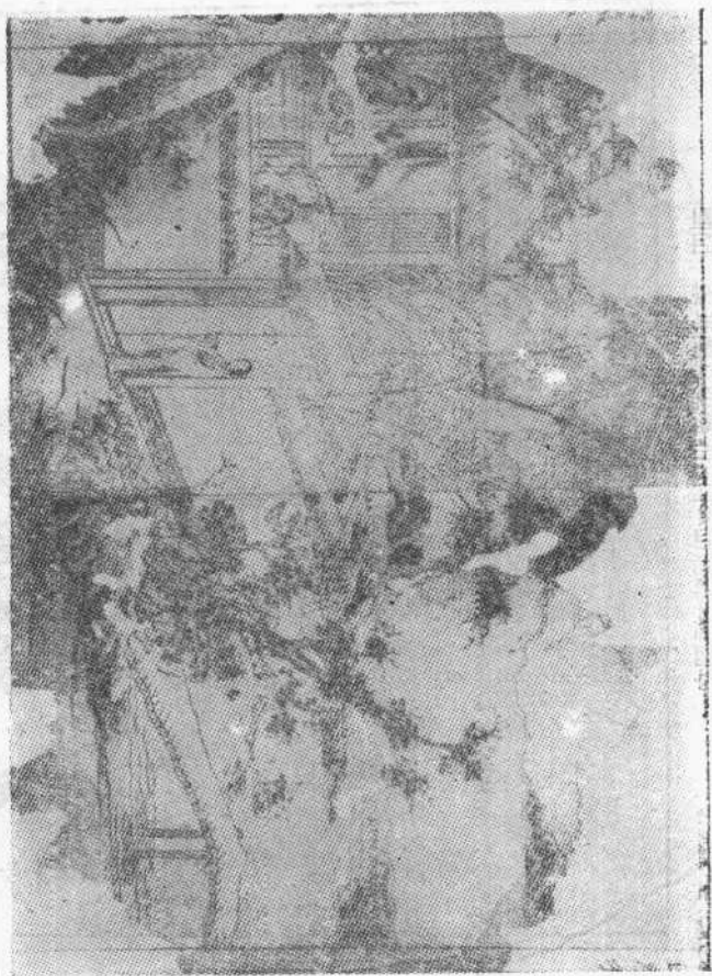
圖五 明刻《四聲猿》插圖 (據《文獻》一九七九年第二輯複製)