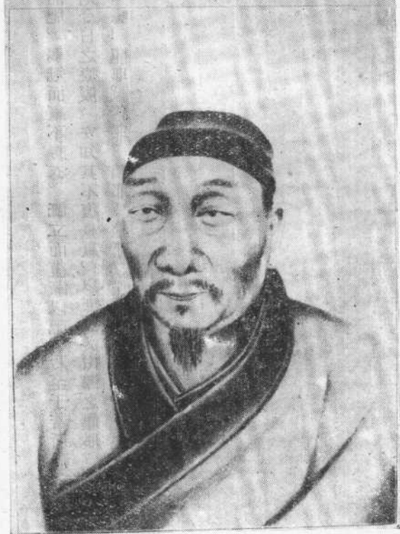
圖一 青藤山人小像 (據明刻《徐文長逸稿》複製)