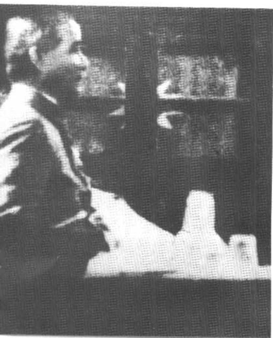
一九二四年孙中山在国民党第一次全国代表大会上讲话