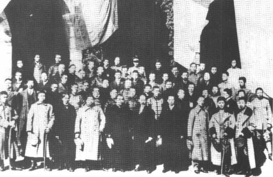
一九一二年孙中山在南京就临时大总统职