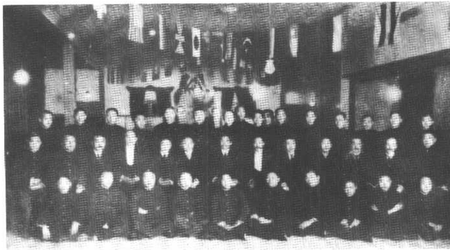
一九〇五年同盟会在东京成立，二排左起第七人为孙中山