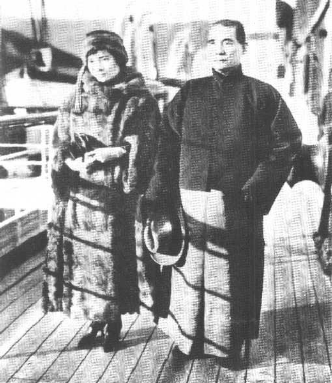
一九二四年经日本 北上至天津时在船上