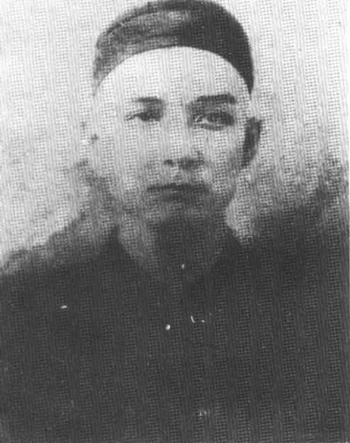
十八岁时的孙中山