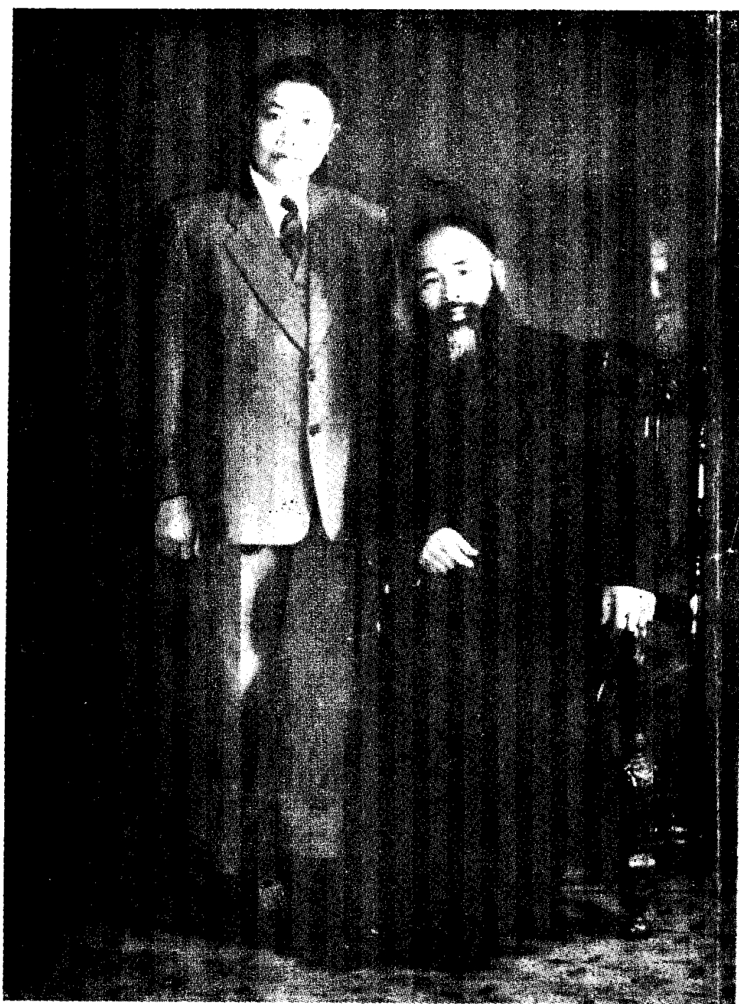
影合生先超云凌与子夫千大张 港香于月春年八四九一