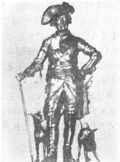
弗里德里希二世塑像

承了威廉的衣钵，即崇尚武功。他决心利用和加强父亲留下的这支军队，进一步扩张普鲁士的版图，逐步实现他称雄欧洲的抱负。故在登基的当年，就刻不容缓地以一场侵略战争拉开了他四十六年统治的序幕。