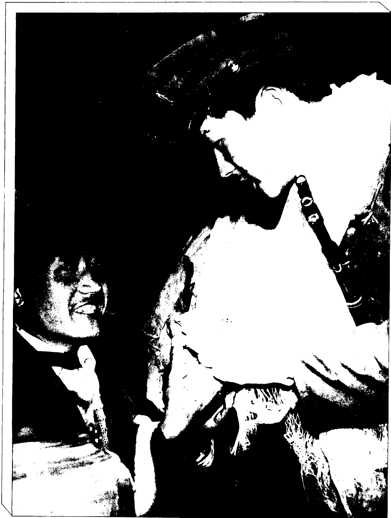
1990年5月1日零点，拉萨解除戒严。图为八廓街居民提着青稞酒送别即将撤离岗哨的指战员。