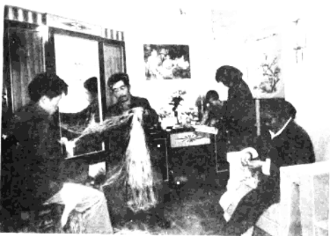
△ 人口兴旺的一家 ▽ 普通生活的渔民一家