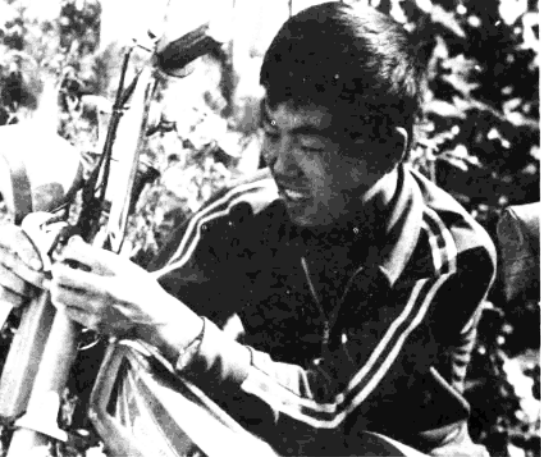
渔民爱上了摩托车