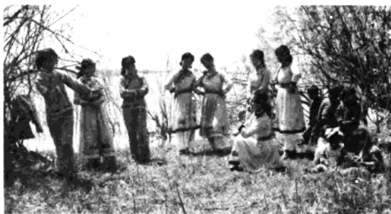
业余文艺宣传队在排练