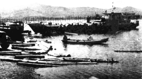
渔民用的汽车、拖拉机、轴船